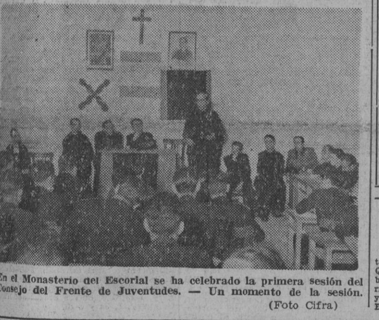
En el Monasterio del Escorial se ha celebrado la primera sesión del Consejo del Frente de Juventudes. — Un momento de la sesión.

"El programa Roosevelt-Churchill, sin valor para los Estados Unidos"