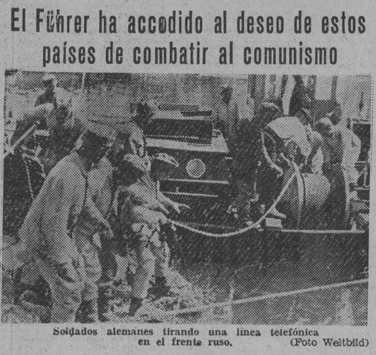
Soldados alemanes tirando una línea telefónica en el frente ruso.

NORUEGA Y DINAMARCA envían ejércitos voluntarios contra Rusia El Führer ha accedido al deseo de estos países de combatir al comunismo