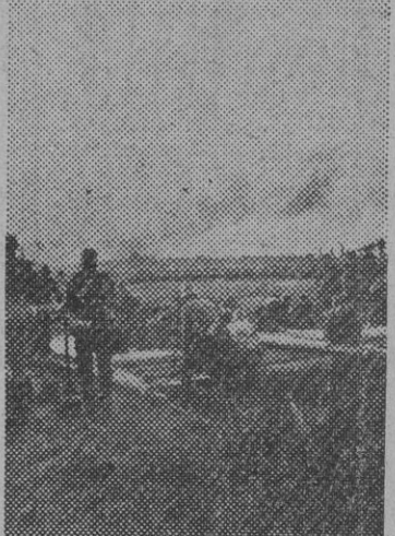
Soldados pontoneros alemanes construyendo un pontón. Al fondo se dibuja el humo de la artillería.