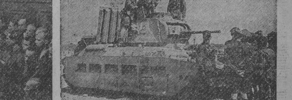
El general Rommel, jefe del heroico cuerpo alemán africano, examinando un tanque inglés, capturado en la zona de combate de Tobruk.

El ministro alemán de Relaciones Exteriores, von Ribbentrop, da lectura a la nota del Gobierno del Reich a la U. R. S. S., declarando la guerra, delante de los representantes de la Prensa alemana y extranjera.