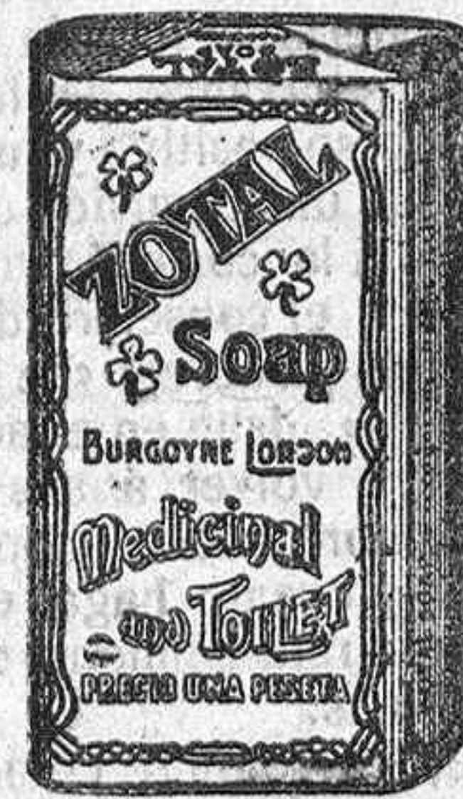
Envase del JABON ZOTAL

EL MEJOR DESINFECTANTE PARA LA HIGIENE - CURA LAS ENFERMEDADES DEL GANADO, VIÑAS, PLANTAS Y ARBOLES FRUTALES - INDISPENSABLE PARA COMBATIR LA LANGOSTA - CON SU USO SE EVITAN LAS ENFERMEDADES CONTAGIOSAS