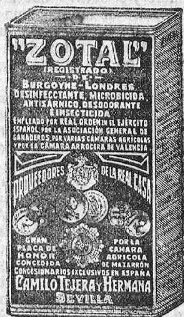
Nuevo envase del ZOTAL

Aparatos sanitarios. - Vidrio plano. - Arcas para caudales. - Básculas, etc. CORRILLO, 4 Y 6 - SALAMANCA