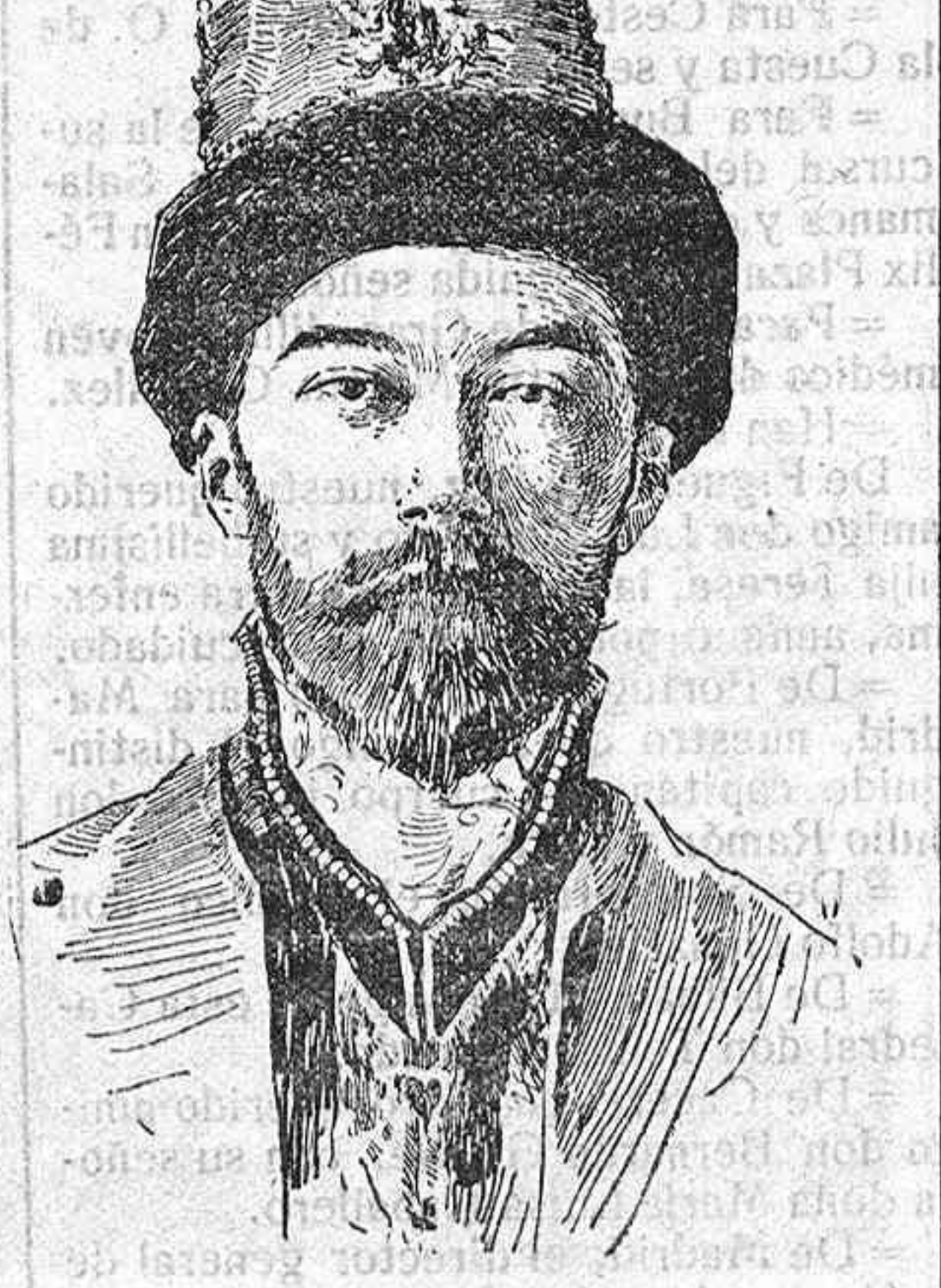
El Czar, Nicolás.