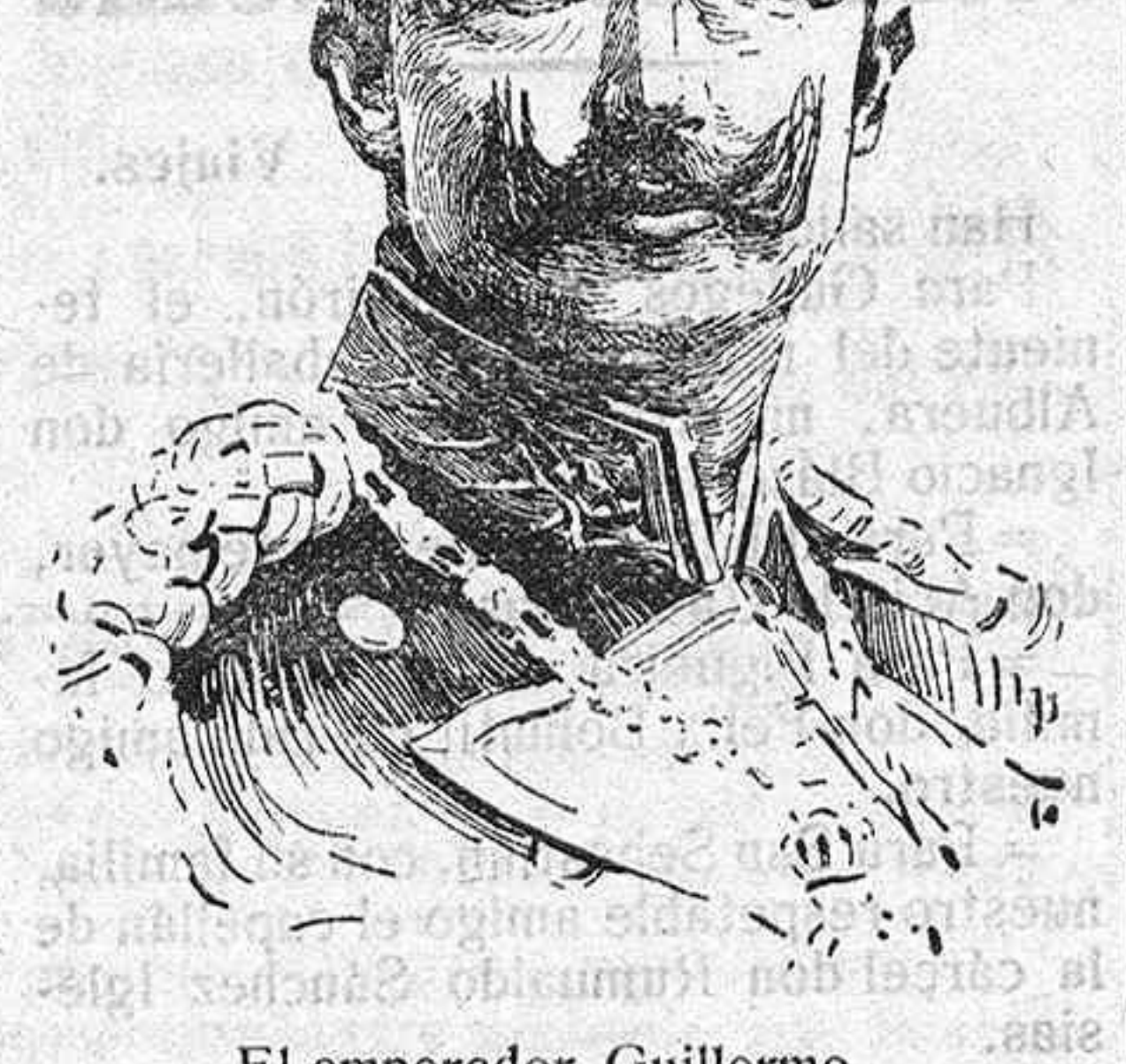
El emperador Guillermo.

—¡Es que me siento feliz cuando te puedo dar un gusto! La hija le abrazó. El se miraba á sí mismo y el recuerdo de la fofra hija, la tísica, le hizo estrechar con más fuerza entre sus brazos á la suya, como si temiese también que pudiese arrebatársela la muerte.