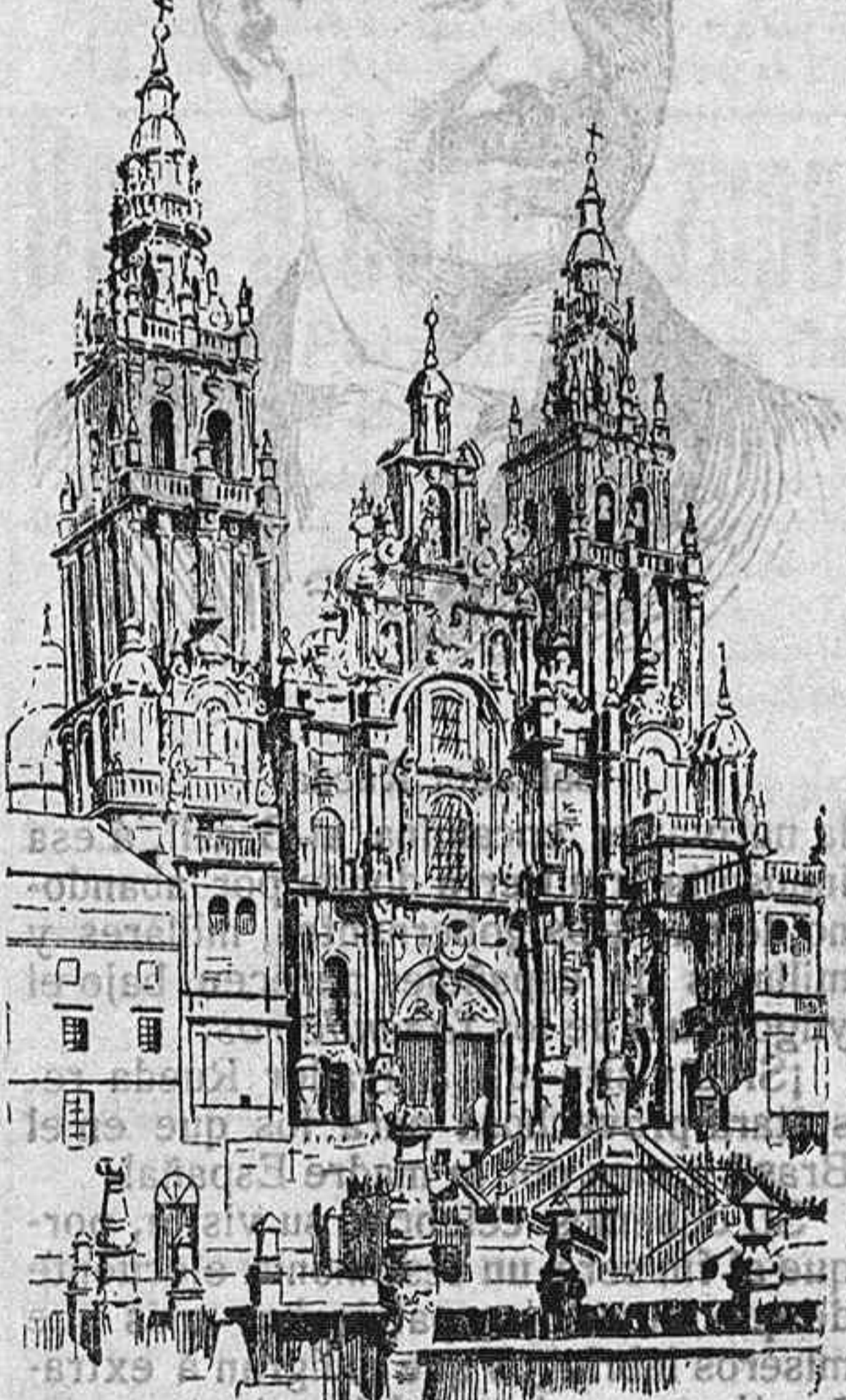
Fachada del Obradoiro de la Basílica Compostelana.

es el periódico de mayor circulación en la provincia, y, por lo tanto, el más conveniente para los anunciantes.