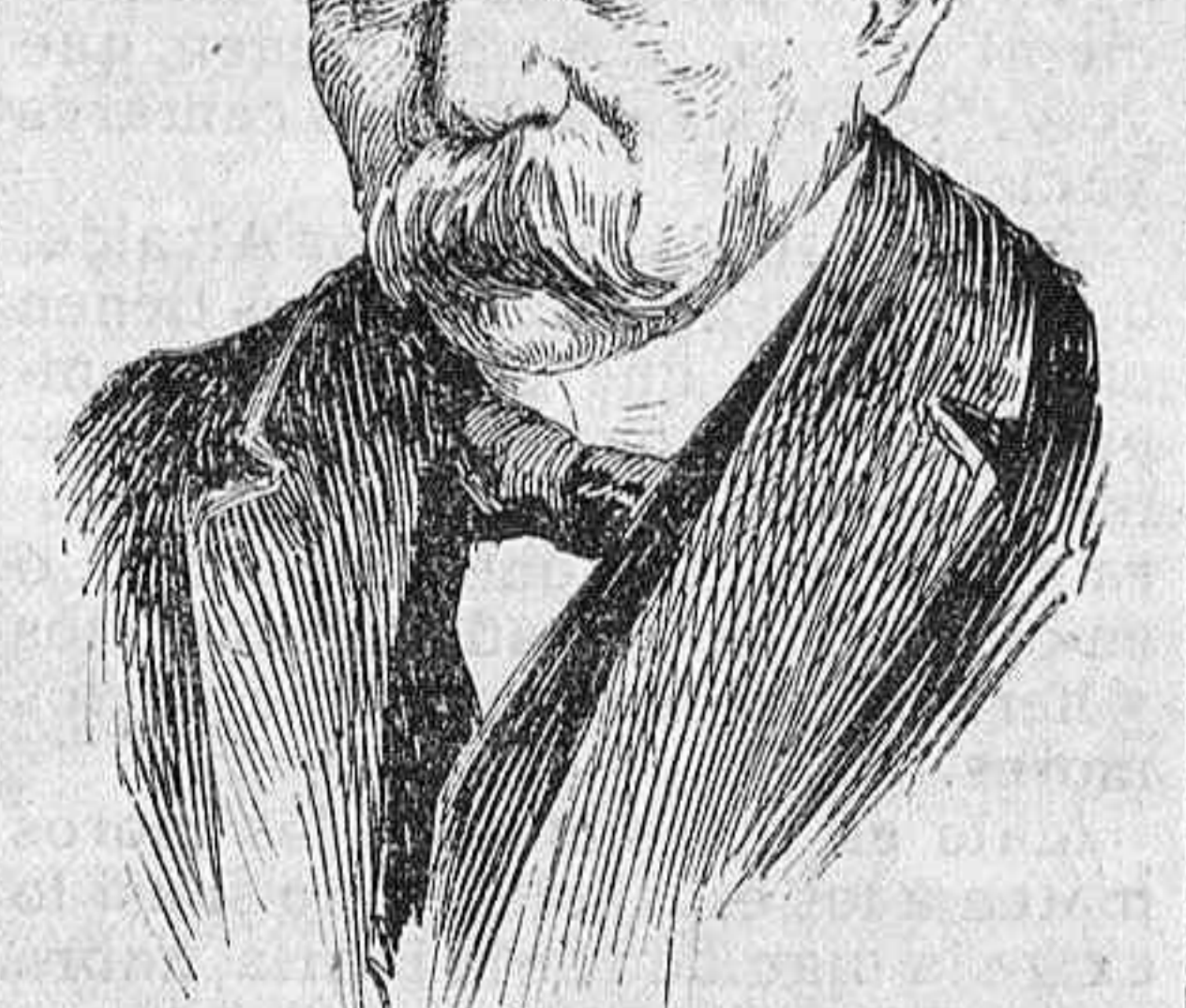
Monsieur Clemenceau presidente del Consejo de ministros dimisionario de Francia.