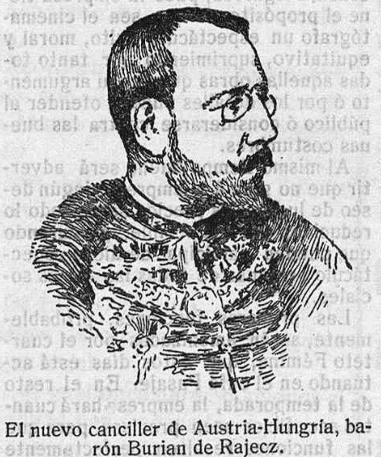
El nuevo canciller de Austria-Hungría, barón Burian de Rajecz.

Los negocios de trigos extranjeros son difíciles, y la demanda se muestra reservada.