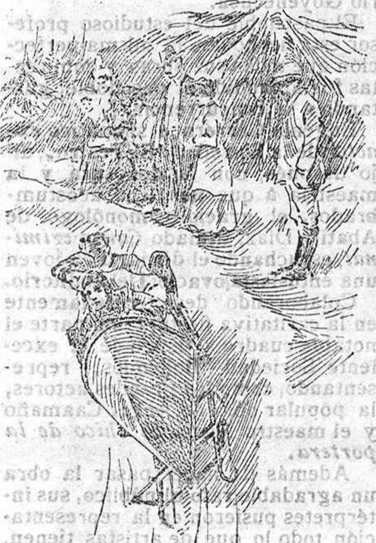
Un mototipo «torpedo» en el momento sensacional de tomar una vuelta en la carrera San Moritz-Celerina.

En el cantón suizo de Gaisones y en la región llamada Engadine Superior, existe uno de los parajes más bellos y encantadores que puede ofrecer Suiza a los ojos del «torista» en la presente estación: San Moritz. Cortan sus horizontes multitud de montañas, hoy completamente cubiertas de nieve, de mucha elevación, pero todas de caprichosas líneas y de fácil acceso. Entre las faldas de esas montañas, extiéndense pequeños valles y cañadas, en los que