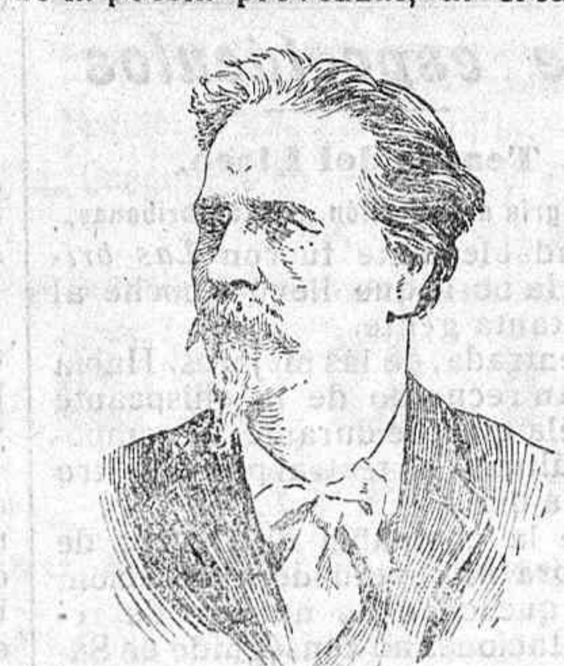
Mistral. del Félibrige, con motivo del cincuentenario de la publicación de «Mireille». Las fiestas, á las que asisten representaciones de la Academia