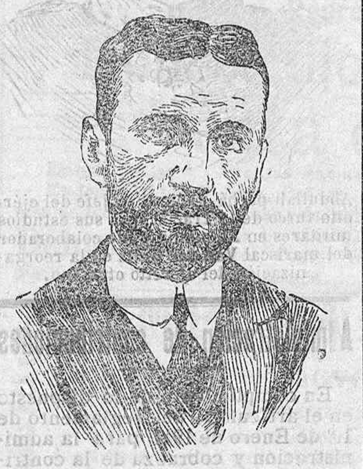
Mario G. Menocal nuevo presidente de la República de Cuba.