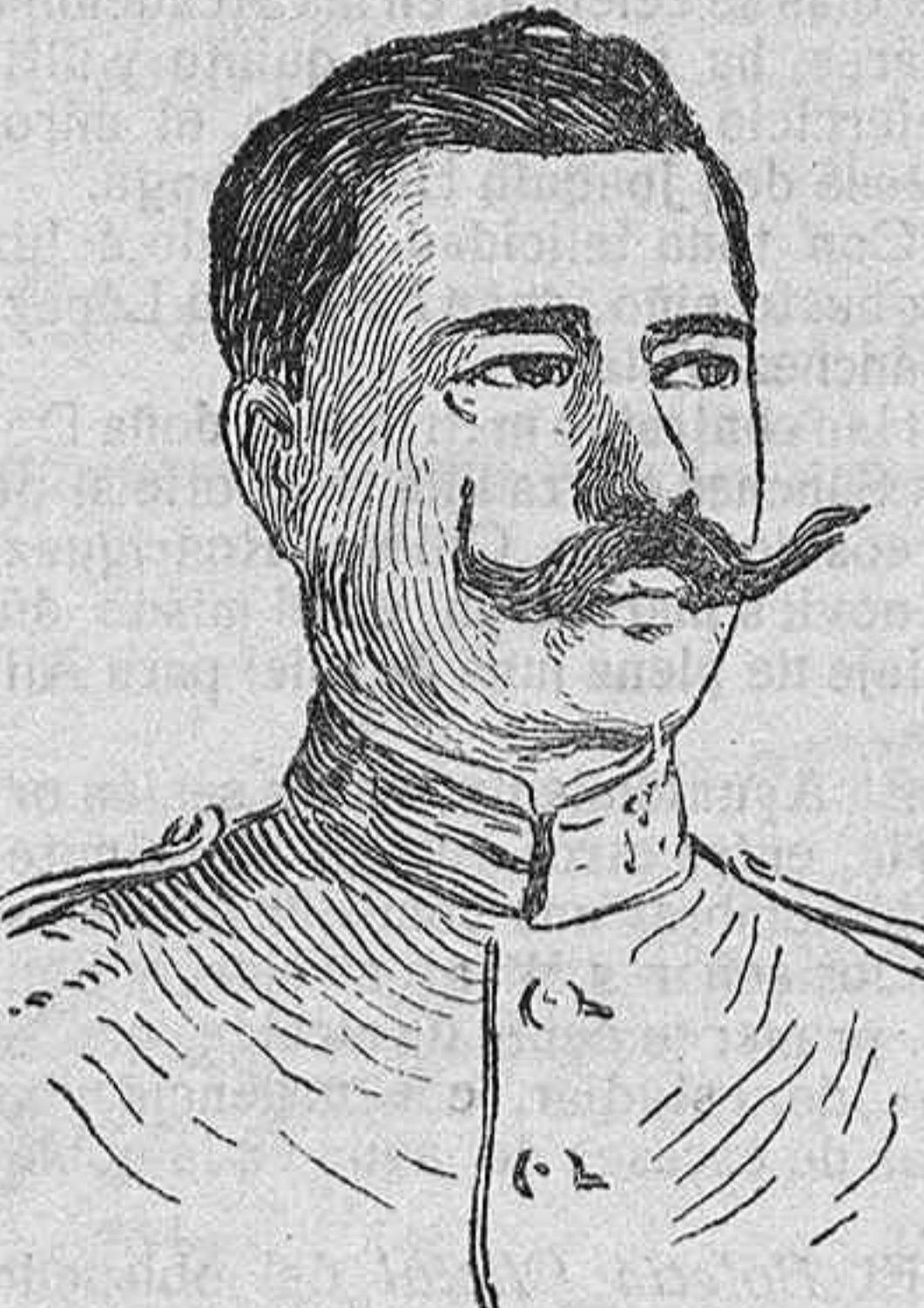
General Fernández Silvestre.

sido nombrado el general Jordana, quien ha sido ascendido á teniente general. El general Fernández Silvestre ha