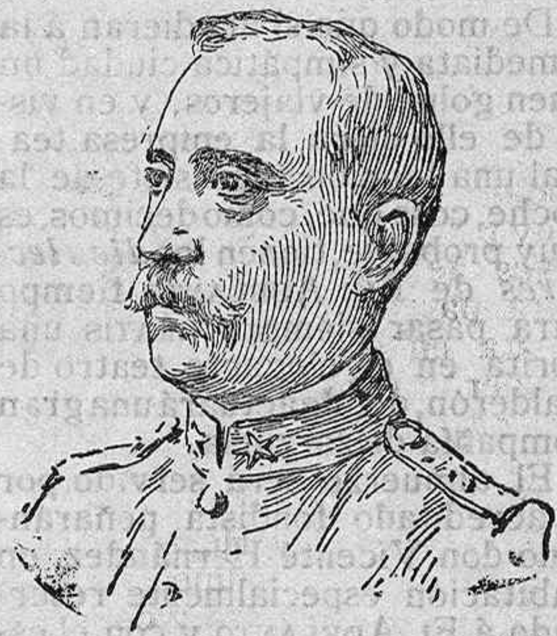
El general italiano Amelio, vencedor de los turcos en Pistoia.