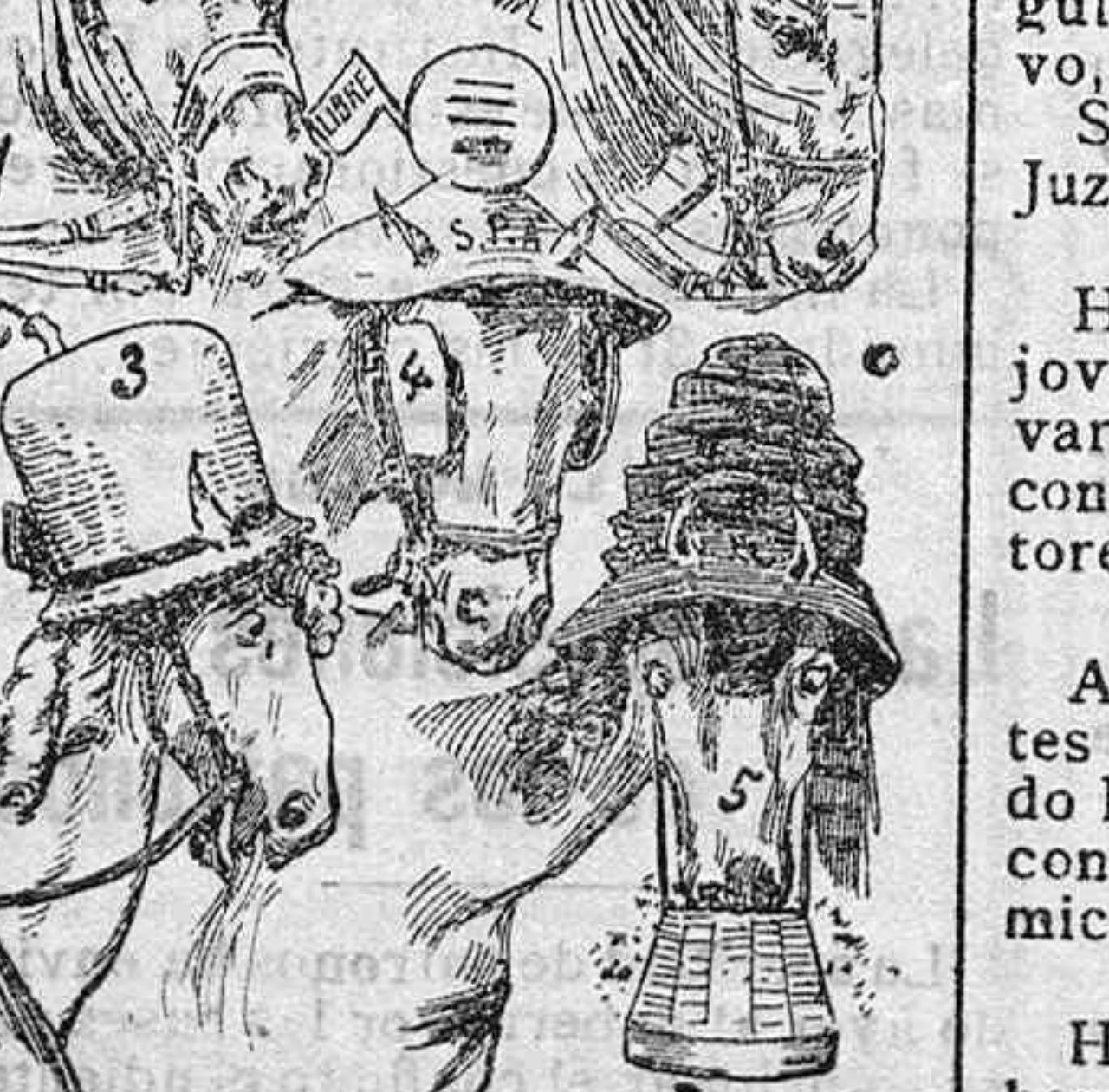
1. El caballo militar. 2. El de la amazona. 3. El de la jovenzuela. 4. El del símon. 5. El de solterona.

El Boletín termina con una importante comunicación del Gobierno ruso según la cual el Consejo de ministros de dicho país ha decidido perfeccionar el servicio de estadística agrícola con objeto de facilitar la obra del Instituto internacional de Agrícola.