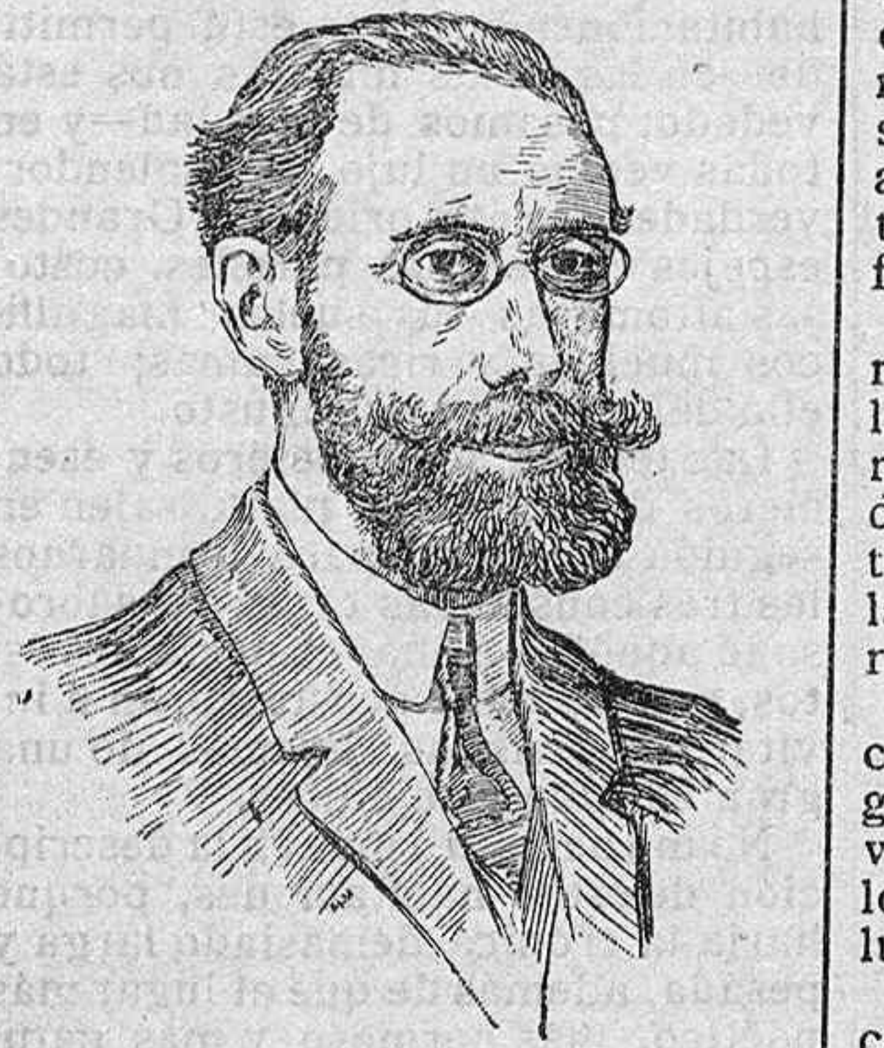
El maestro Conrado del Campo, autor de la obra «El final de don Alvaro», a quien ha sido premiada una nueva obra en el último concurso abierto por el Estado, la cual será estrenada en el Teatro Real.

Los precios por mercadería propia para Europa son: Buenos Aires 15 por 100 desechos 11 a 12 kilos, de francos 145 a 150 1/2 los 50 kilos cif.; Buenos Aires desechos 11 a 12, de 140 a 145; Buenos Aires, inservibles 11 a 12, de 117 a 120; becerros todos los pesos, de 145 a 150; Córdoba 15 por 100 desechos 11 a 12, de 160 a 195; ídem becerros 5 a 6 kilos, de 160 a 165; Entreríos y corrientes libras de verano, pesados é inservibles, 9 a 11 kilos, de 152 a 157 1/2.