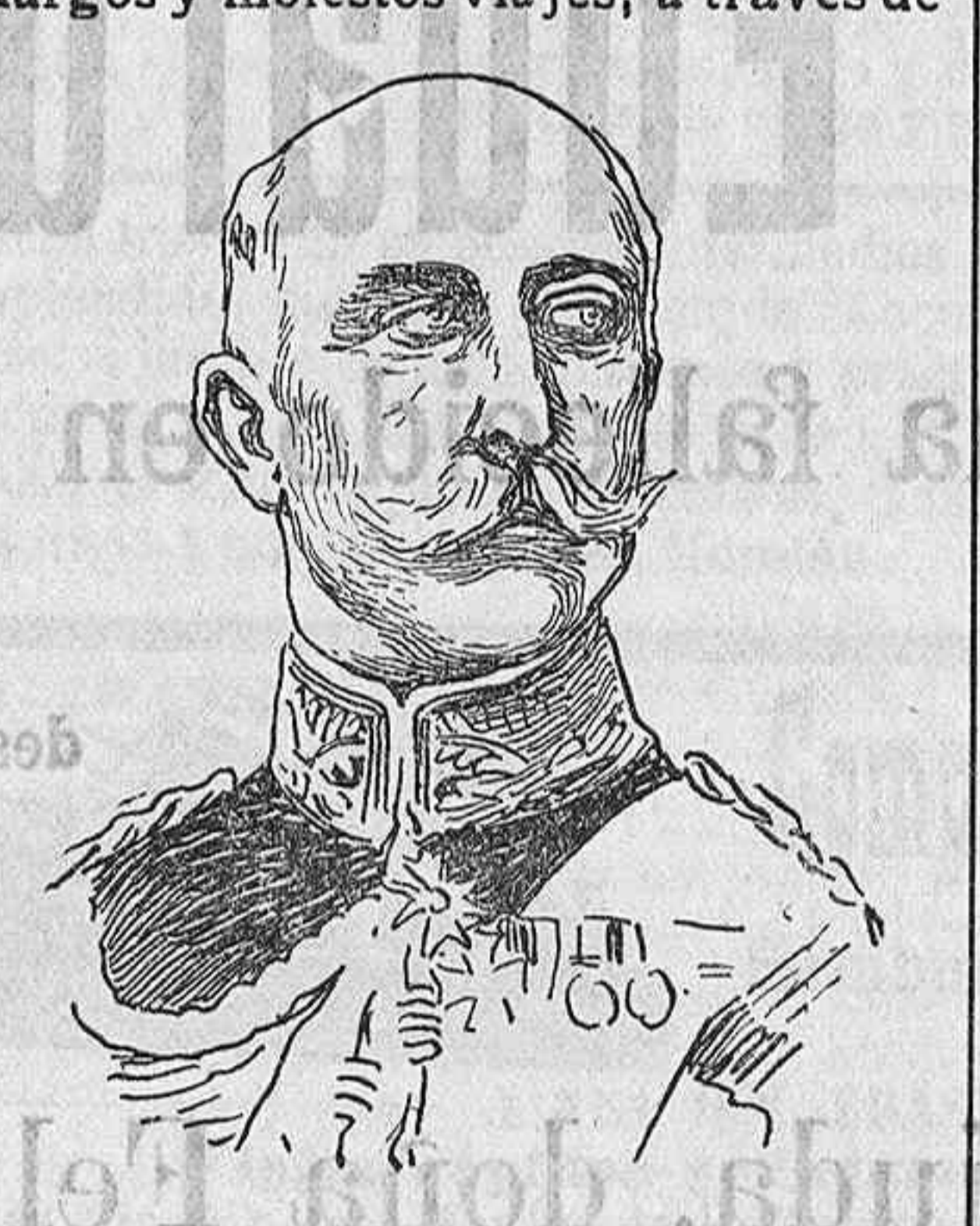
El duque de Connaught.

Sin embargo de que la edad de estos egregios exploradores no es la más á propósito para entregarse á largos y molestos viajes, á través de