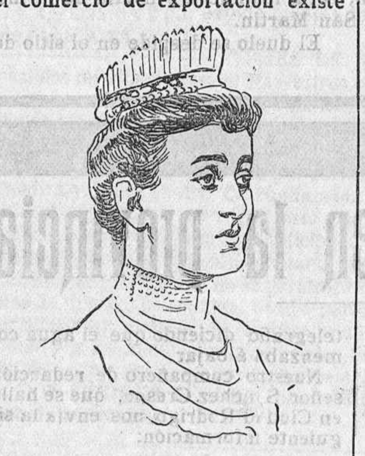
La duquesa de Connaught.

Dado el antagonismo que tanto en la política internacional como en el comercio de exportación existe