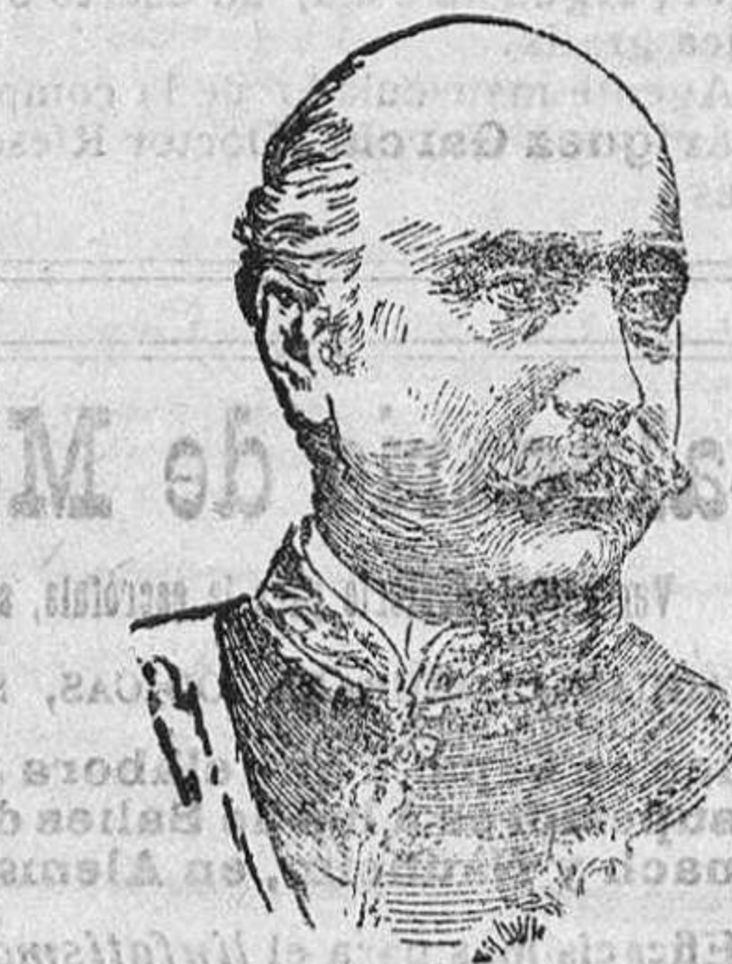
Navarrotreverter (Ministro de Hacienda)

Distribución de fondos provinciales para el próximo mes de Agosto. Se acordó emitir informe en va-