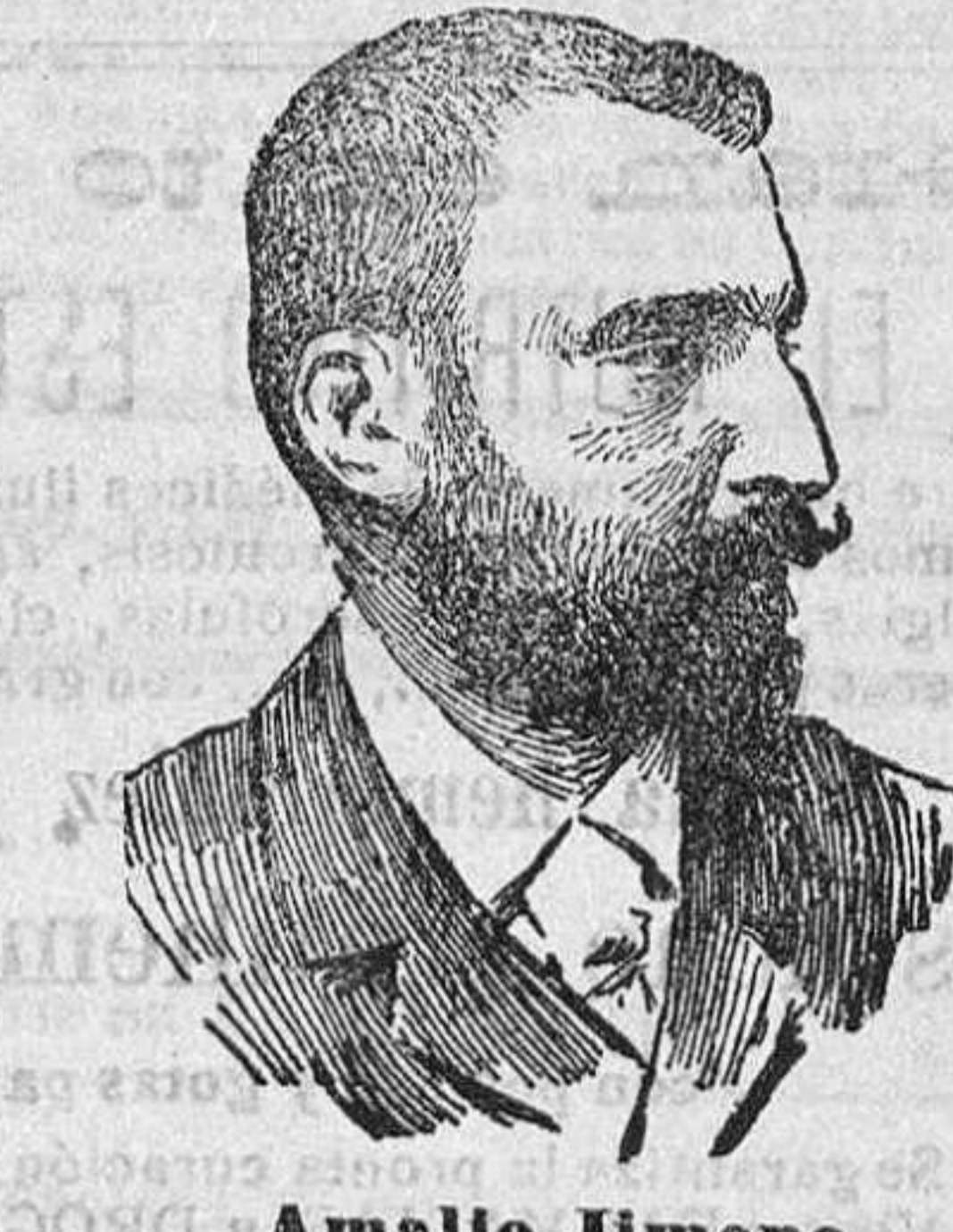
Amalio Jimeno (Ministro de Instrucción Pública)