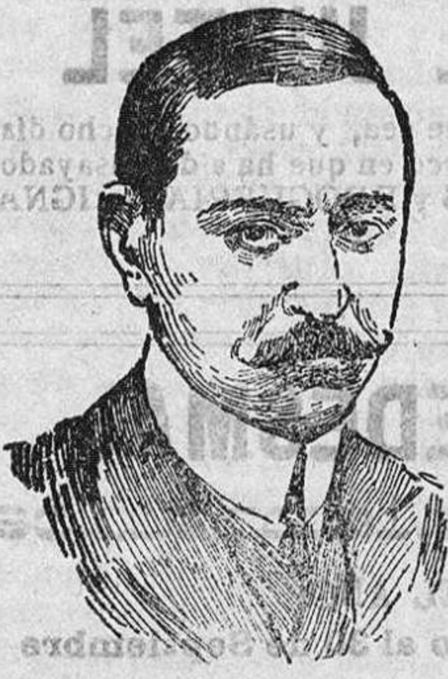
García Prieto (Ministro de Fomento)

Lo ocurrido es lo siguiente: Parece ser que como costumbre generalizada en la comarca de la Sierra de Francia, salió a dormir al campo con sus caballerías un joven de ventitrés años, vecino de referido Cepeda, y cuando se hallaba profundamente dormido, llegaron donde estaba, seis u ocho mozos del mismo, los que, despertándole, le dijeron que habían matado a su hermano y le iban a matar a él, y acompañando la acción a la palabra, sacaron una pistola haciendo un disparo al lado con el propósito de atemorizarle. A continuación le colocaron el caño de referida arma en la boca, haciéndole rezar, porque, según ellos, era legado el último momento de su vida.