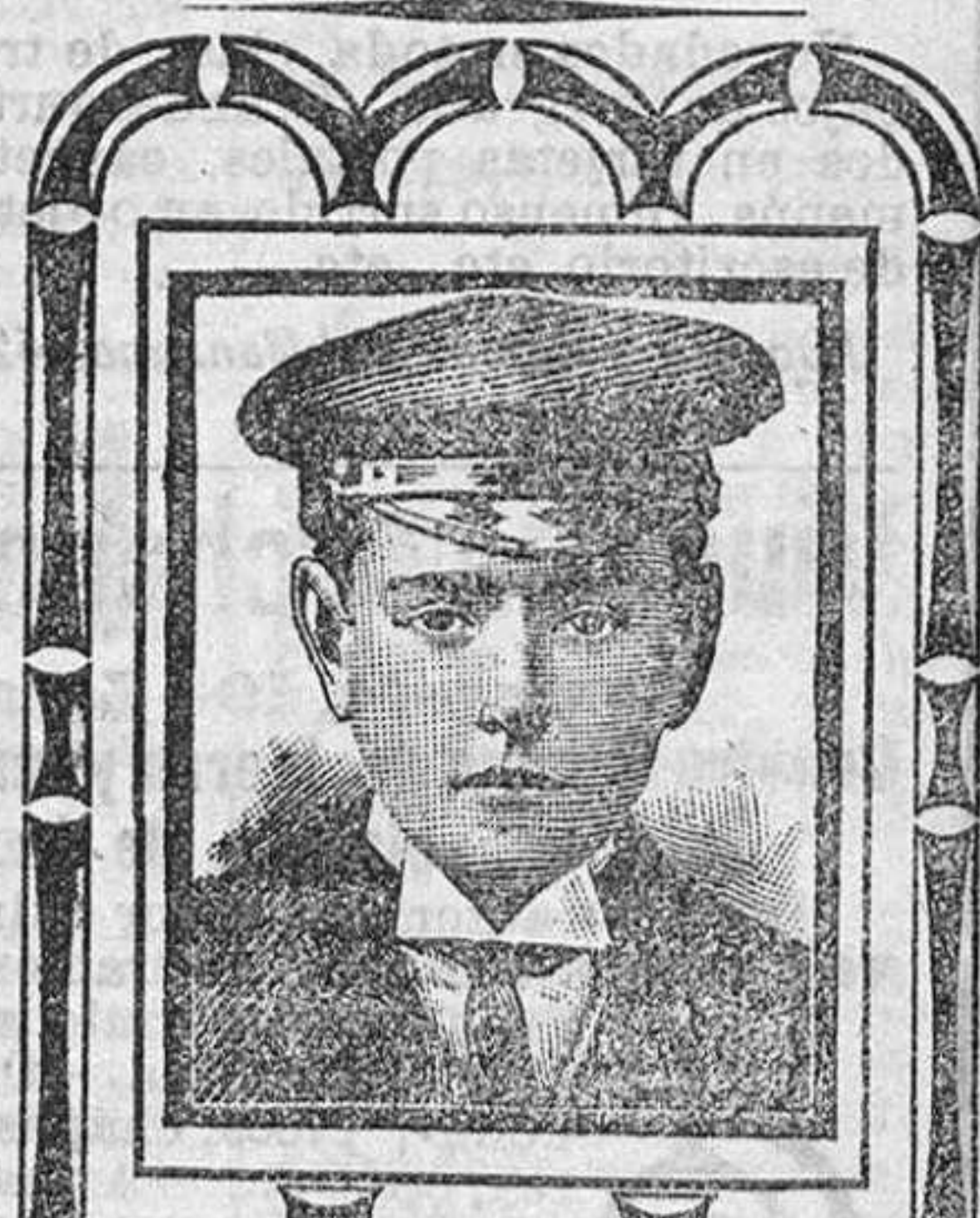
Barcelona, 11 Abril 1908. CALLE CONDÉ ASALTO NO. 42.