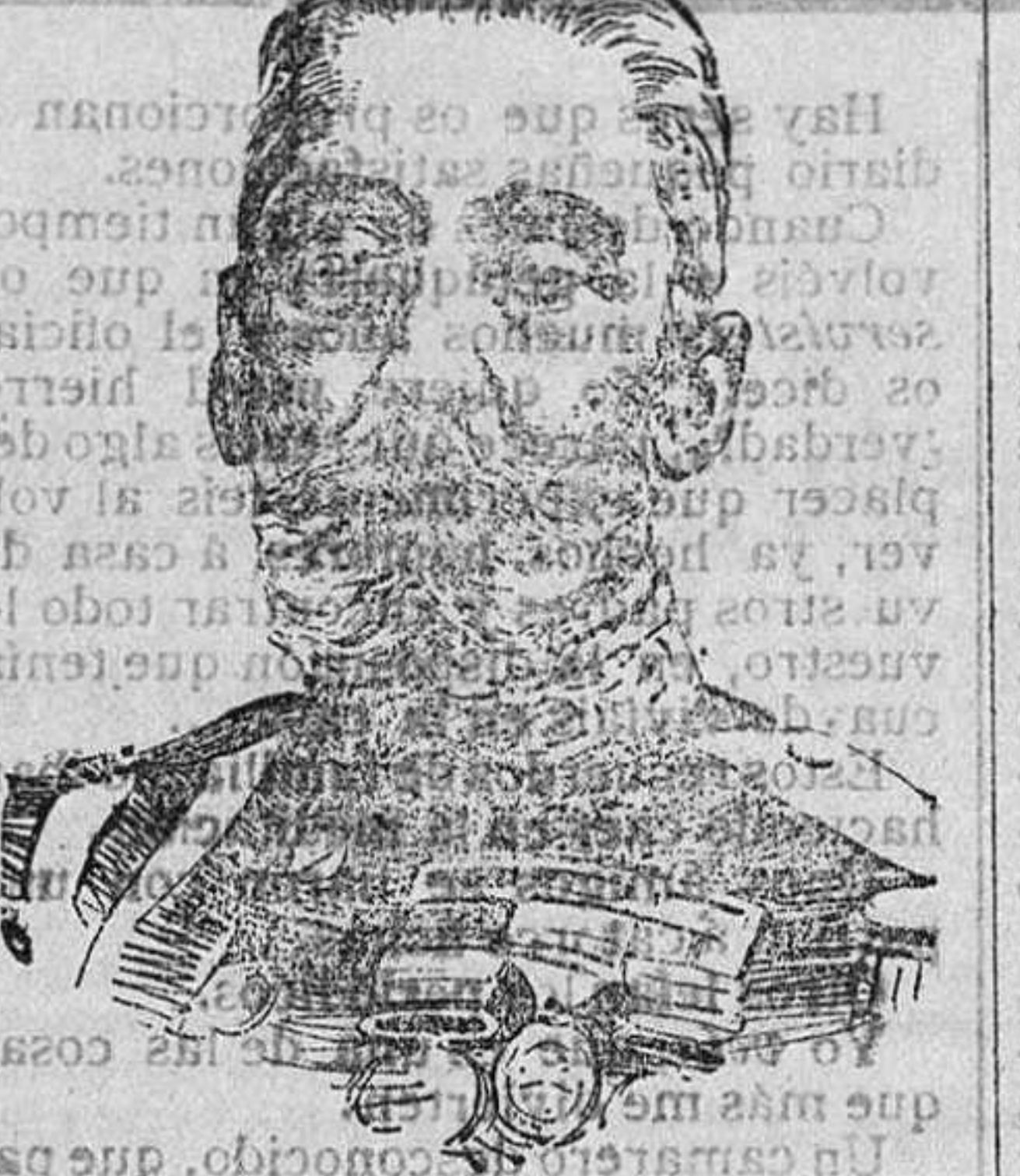
GENERAL LUQUE. Nuevo ministro de la Guerra.