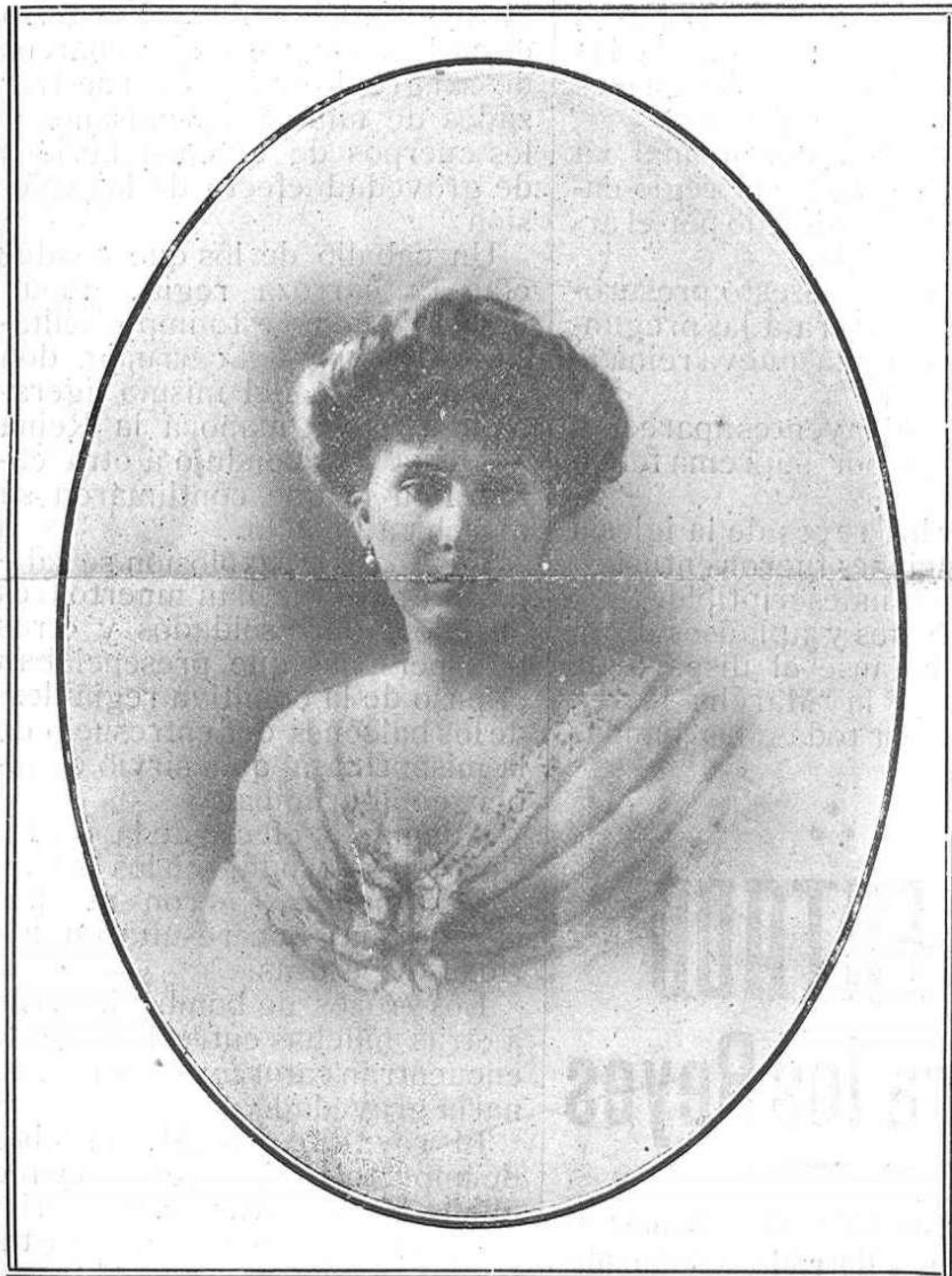
La Reina Victoria.