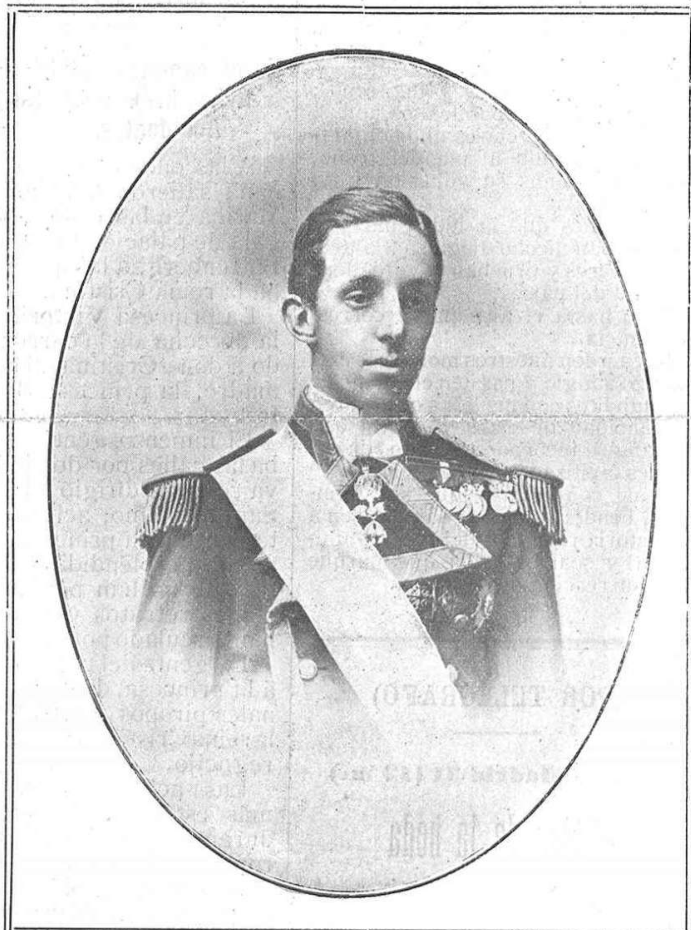
El Rey D. Alfonso XIII.