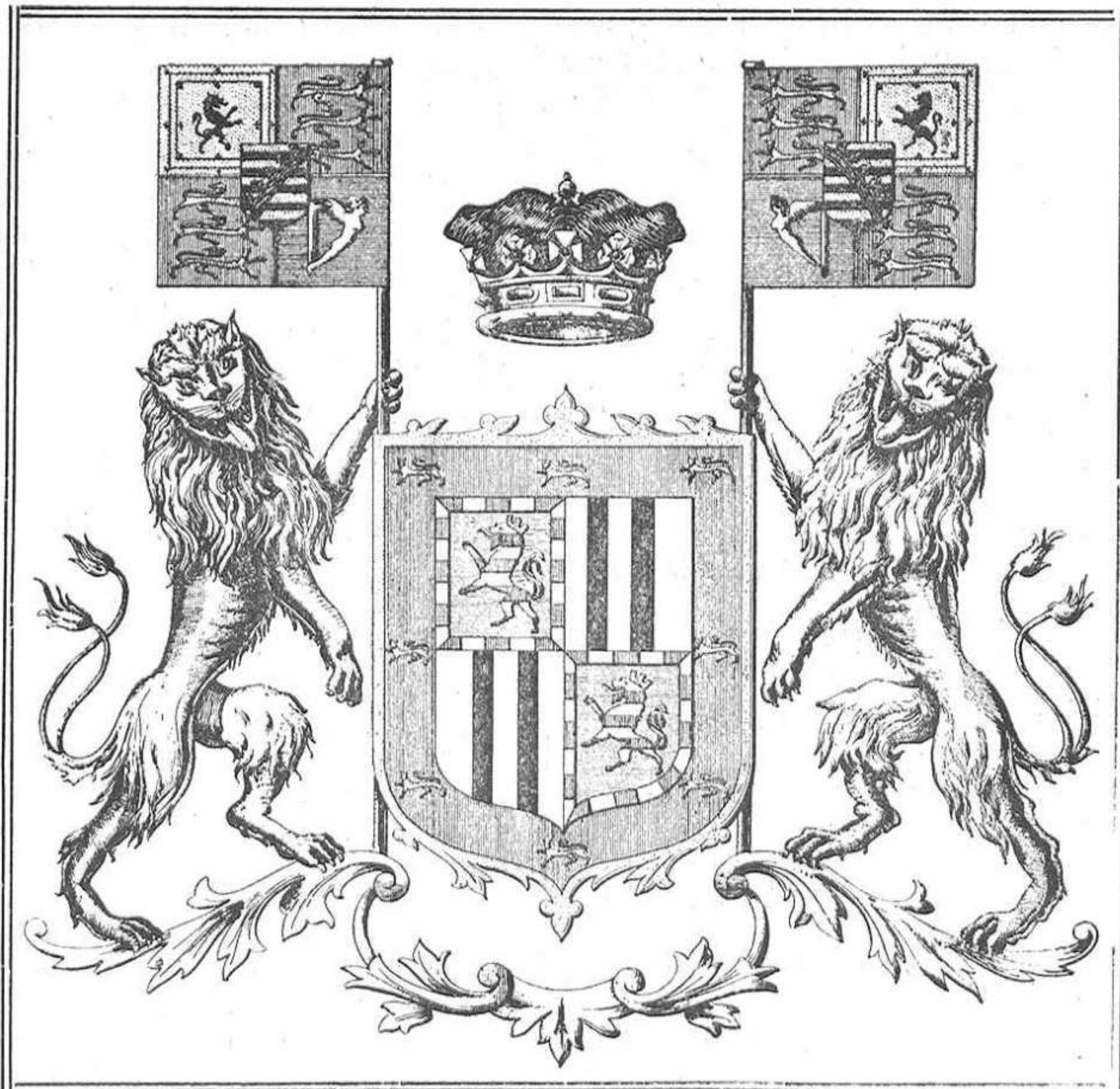
Escudo de armas de la Reina.