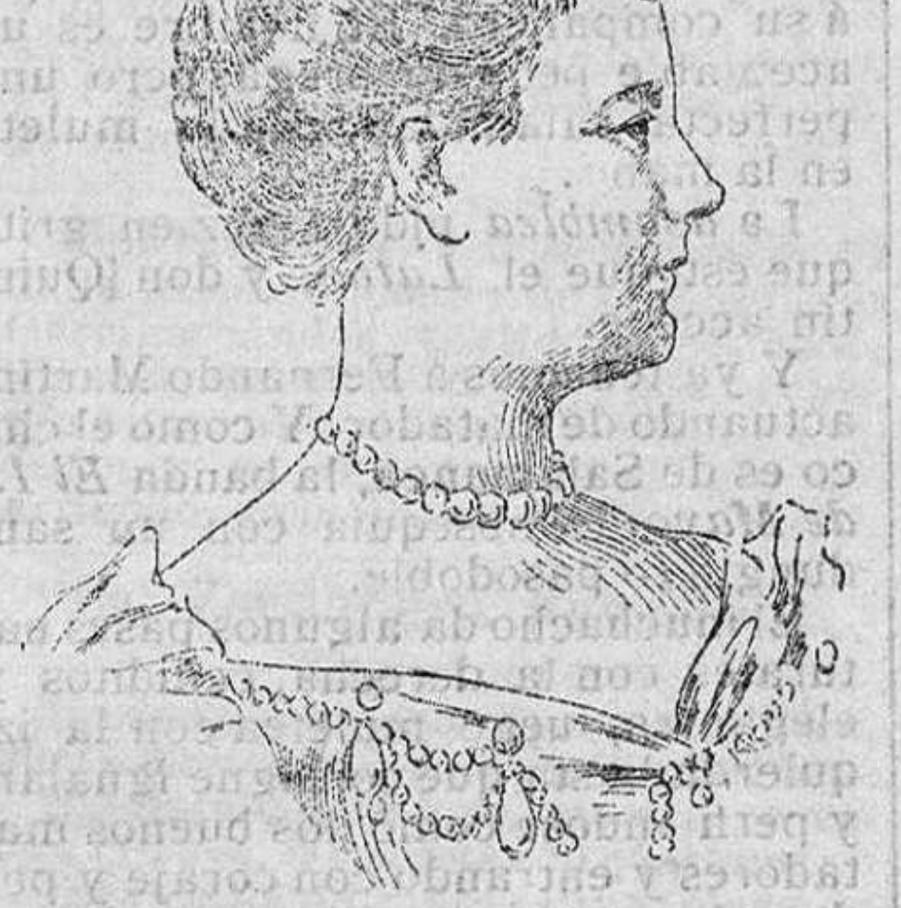
La reina Guillermina.