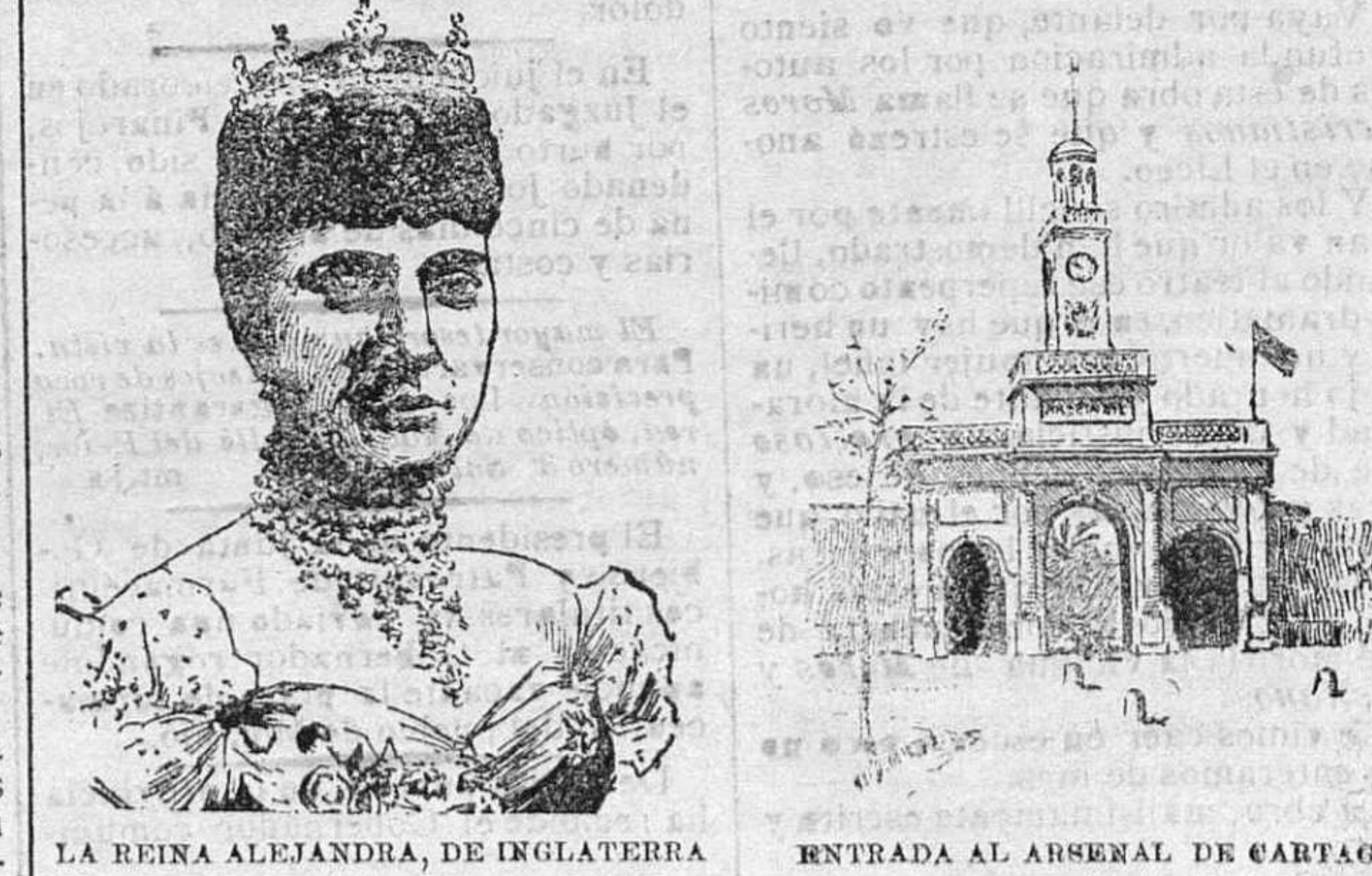
LA REINA ALEJANDRA, DE INGLATERRA ENTRADA AL ARSERAL DE CARTAGENA