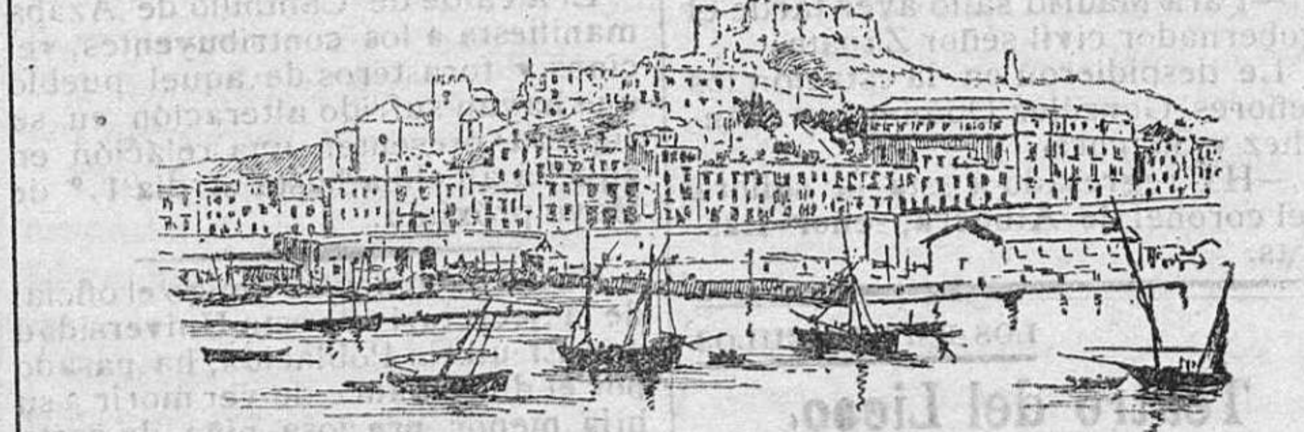
CARTAGENA VISTO DESDE EL MAR