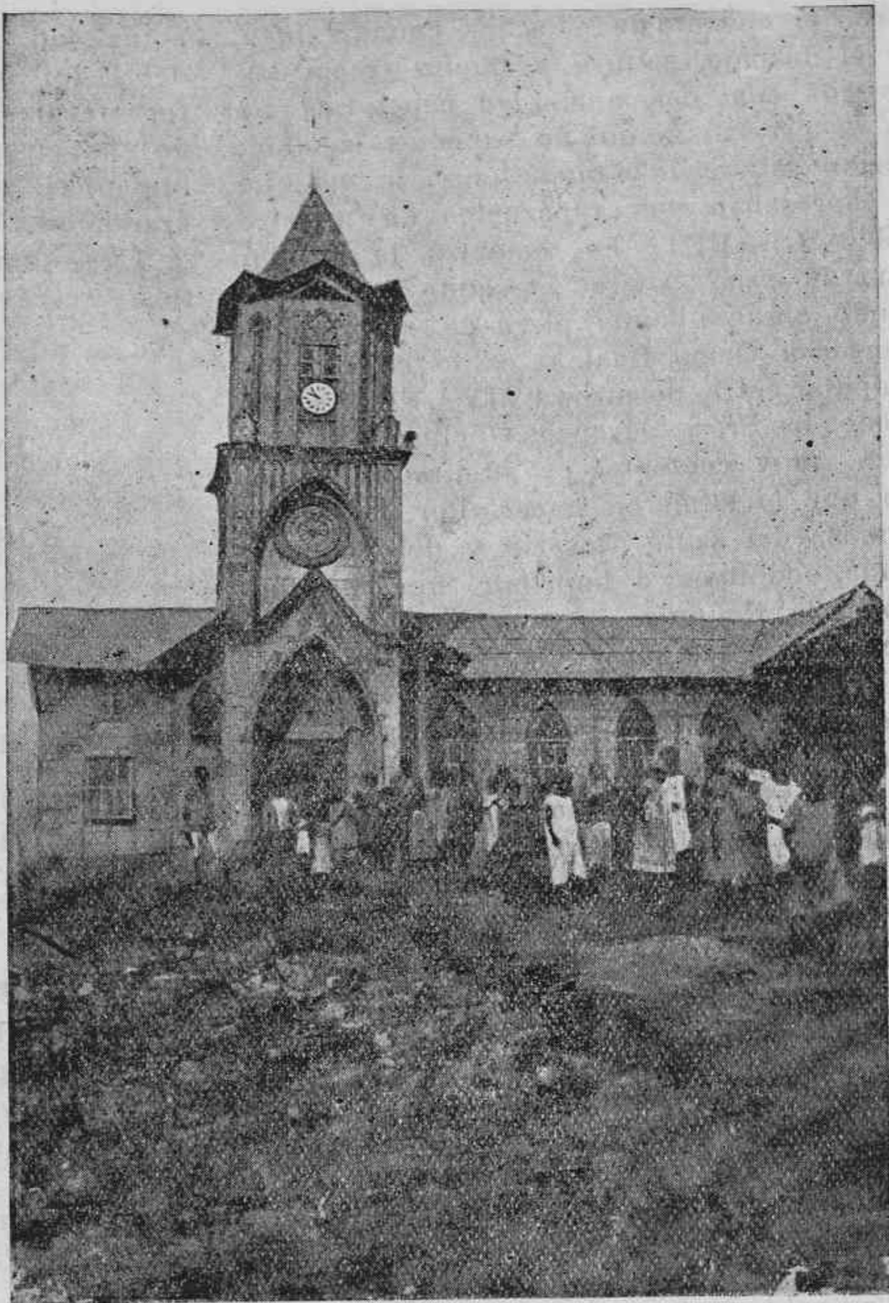
La Iglesia de Batete