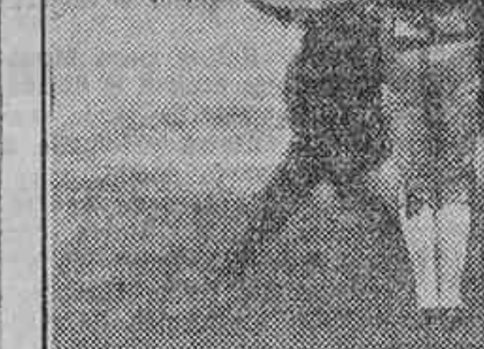
LA CORRIDA GOYESCA EN ZARAGOZA.—EL GALLO EN EL «PASE DE LA MUERTE»

Fortuna, embarrullado y achuchado por el novillo, que gaza-pea, da unos mantazos por la