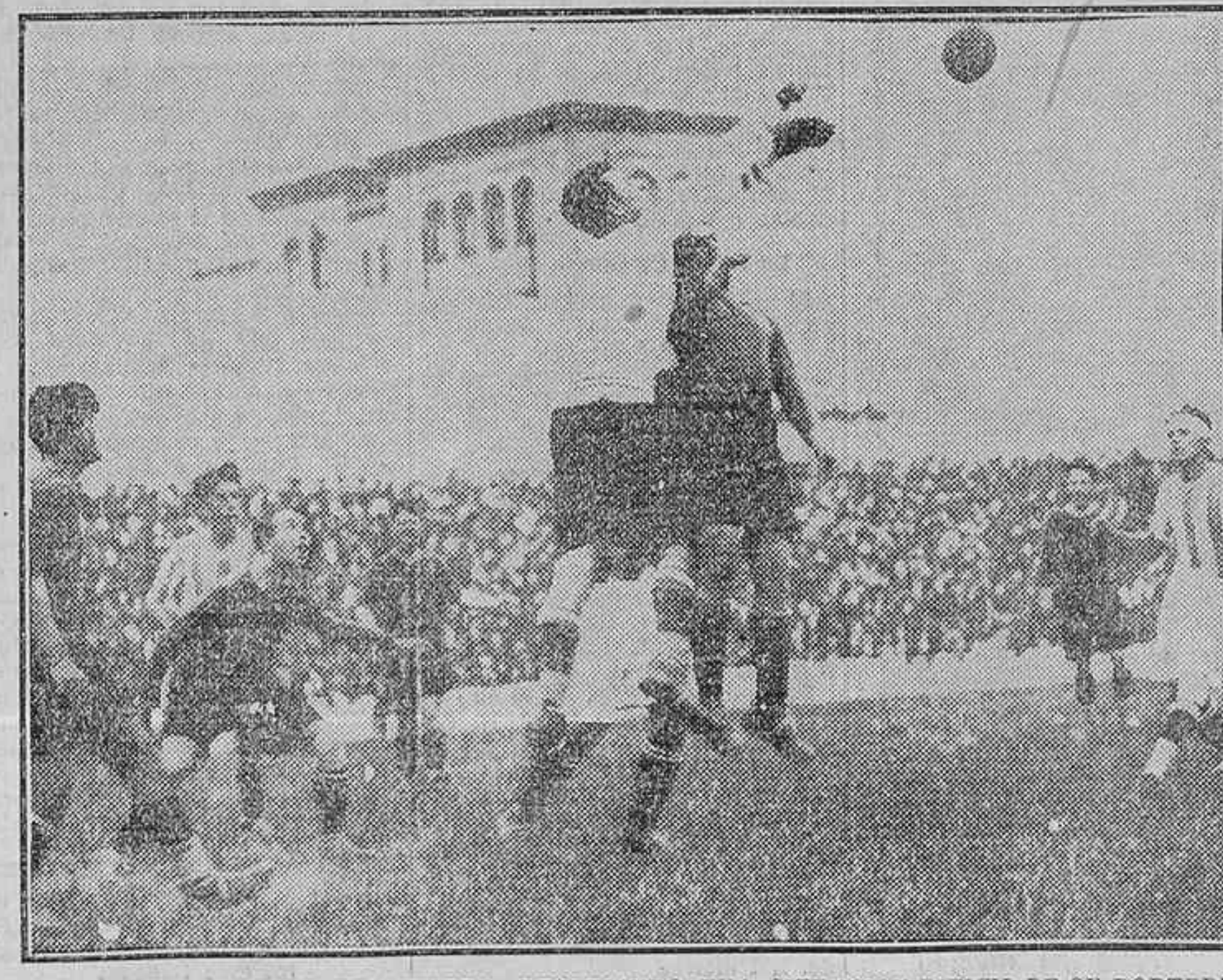
EL PORTERO DEL BETIS, DE SEVILLA, DESPEJANDO UNA SITUACION DIFICIL DE SU PORTERIA

Después de unos momentos en que no se ve nada notable, Rogelio pierde el balón en una entrada de Llantada, cuando éste se cae y le dejaba franco el paso. Pasarin despeja una situación peligrosa, dando origen a un avance de sus delanteros, lanzando Polo un «chut» fantástico que da en el larguero. Recoge Chicha y pasa Reigosa; pero el «aut» de éste le rechaza Jáuregui, despejando,