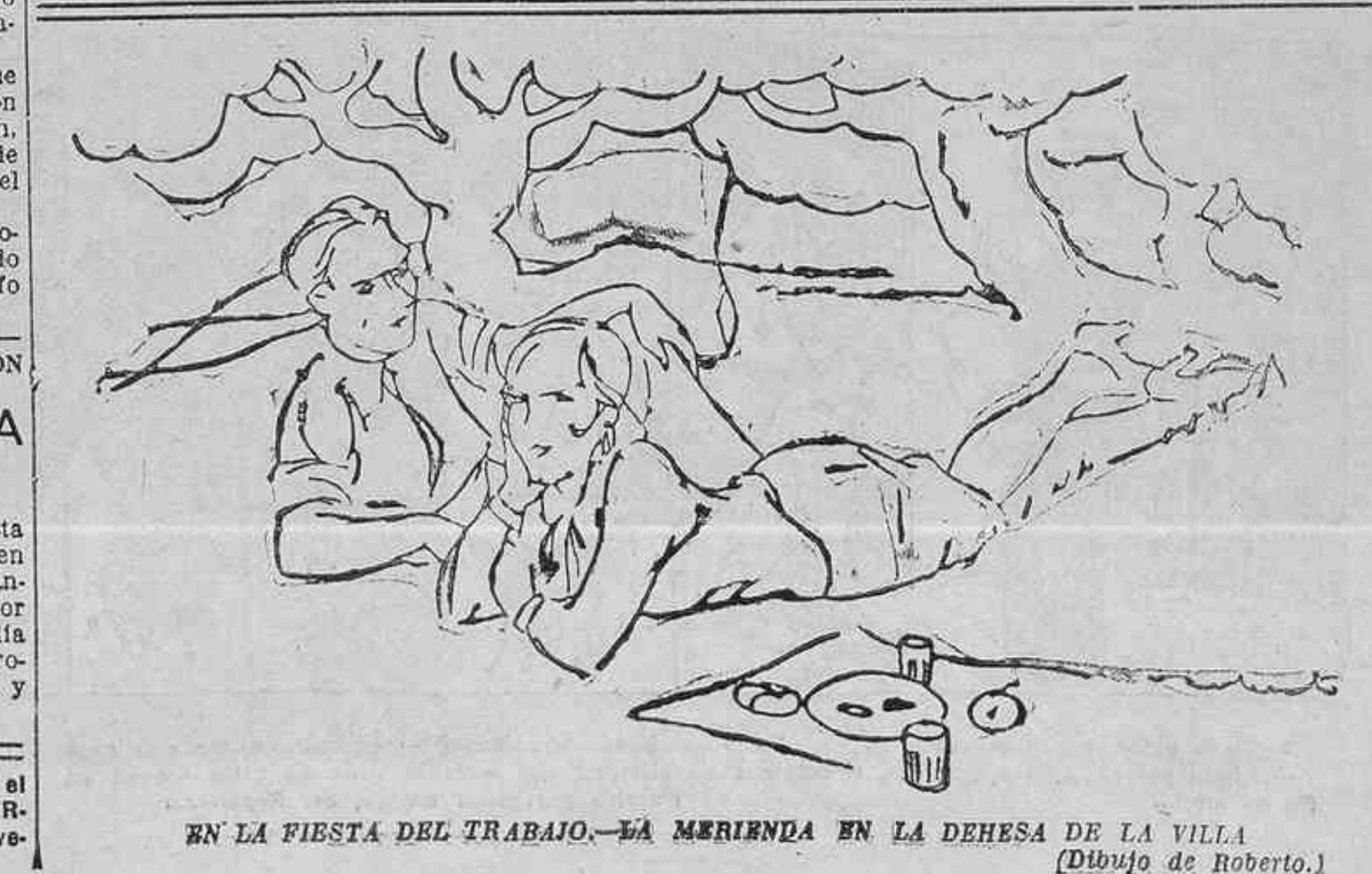
EN LA FIESTA DEL TRABAJO.--LA MERIENDA EN LA DEHESA DE LA VILLA (Dibujo de Roberto.)