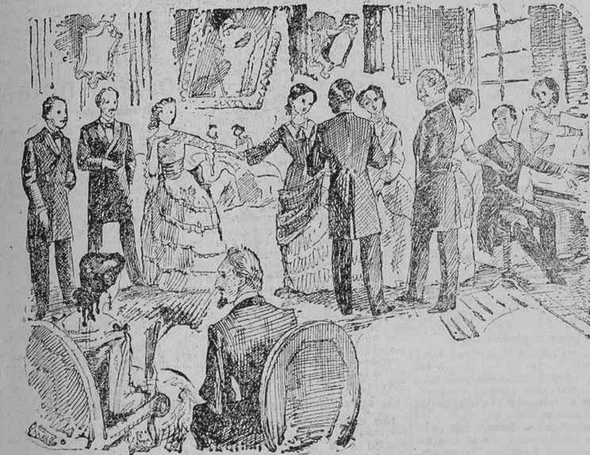
UNA REUNION DE LA CLASE MEDIA MADRILEÑA EN 1867 (Estampa de Enrique García Ormaechea.)

Si vivieran, callaría sus nombres, porque decir de Fulano o Zutano que fueron modelos de gallardía, elegancia y distinción, y contemplarlos ahora, al cabo de los años mil, hechos unas "nadas", desmantelados, barbicaídos, propios para que les den sopitas y buen vino, en espera de que el Todopoderoso les otorgue la licencia absoluta y San Pedro les abra las puertas del Paraíso; hablar de sus proezas amorosas y conquistas de ayer en comparación con el lastimoso estado de hoy, sería tanto como correr el riesgo de que el lector se riese de mí al tropezar con cualquiera de los dos queridos amigos míos a quienes se refiere lo que estoy narrando.