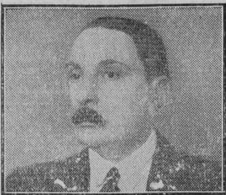
Enrique Larreta, eximio autor de «La gloria de Don Ramiro», que ahora ha publicado otro hermoso libro, titulado «Zogolli»

Leonoras virginales de la romántica poesía, son la alegoría misma del poeta, no ya romántico, sino decadente, venido al Mundo en un instante vespertino, con el alma conturbada por la herencia romántica y la vaga conciencia de su nefasto horoscopo. Es muy probable que el poeta haya tenido la intuición de su analogía con el denostado quirióptero, la visión del lazo trágico que les une ante el odio instintivo de las gentes vulgares. La aparición del poeta no es para el vulgo ese signo nefasto que Baudelaire interpretó? No parece llevar en sí el poeta algo de esa contradicción trágica con el que el huésped del crepúsculo se anuncia extravagante, monstruoso superviviente de un mundo desaparecido, con alas de ave y terribles de mamífero, ratón alado, híbrido, ambiguo, con algo de excesivo y algo de deficiente, como un sueño angélico realizado por manos satánicas?