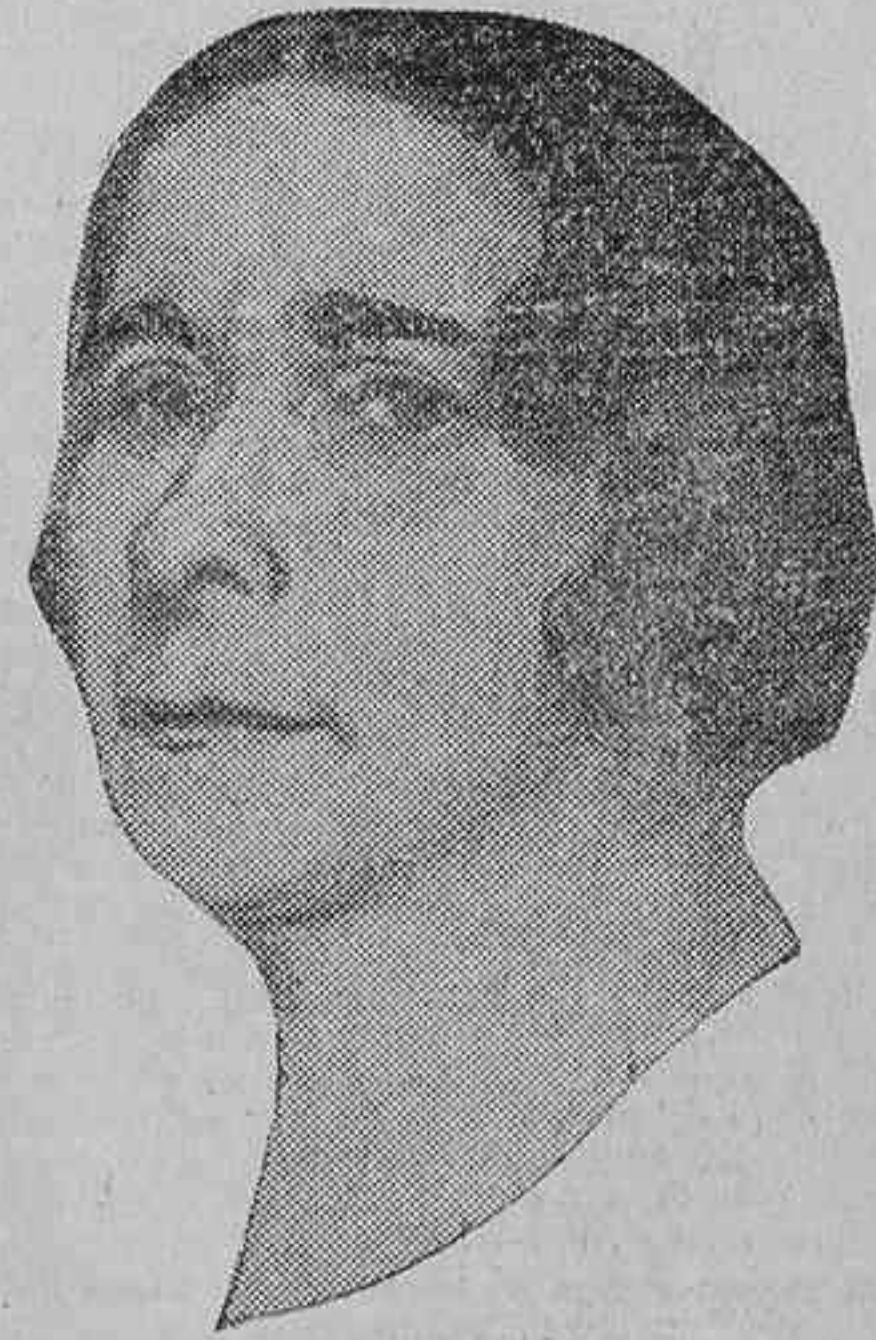
«Beatriz Galindo», ilustre escritora, vicepresidente del Lyceum Club Femenino

«Beatriz Galindo», vicepresidente del Lyceum Club Femenino Español, una de las más insignes escritoras de España; enaltecedora de nuestra patria, en país extranjero, con sus inimitables conferencias, henchidas de una cultura y un amor jamás superados; voz siem-