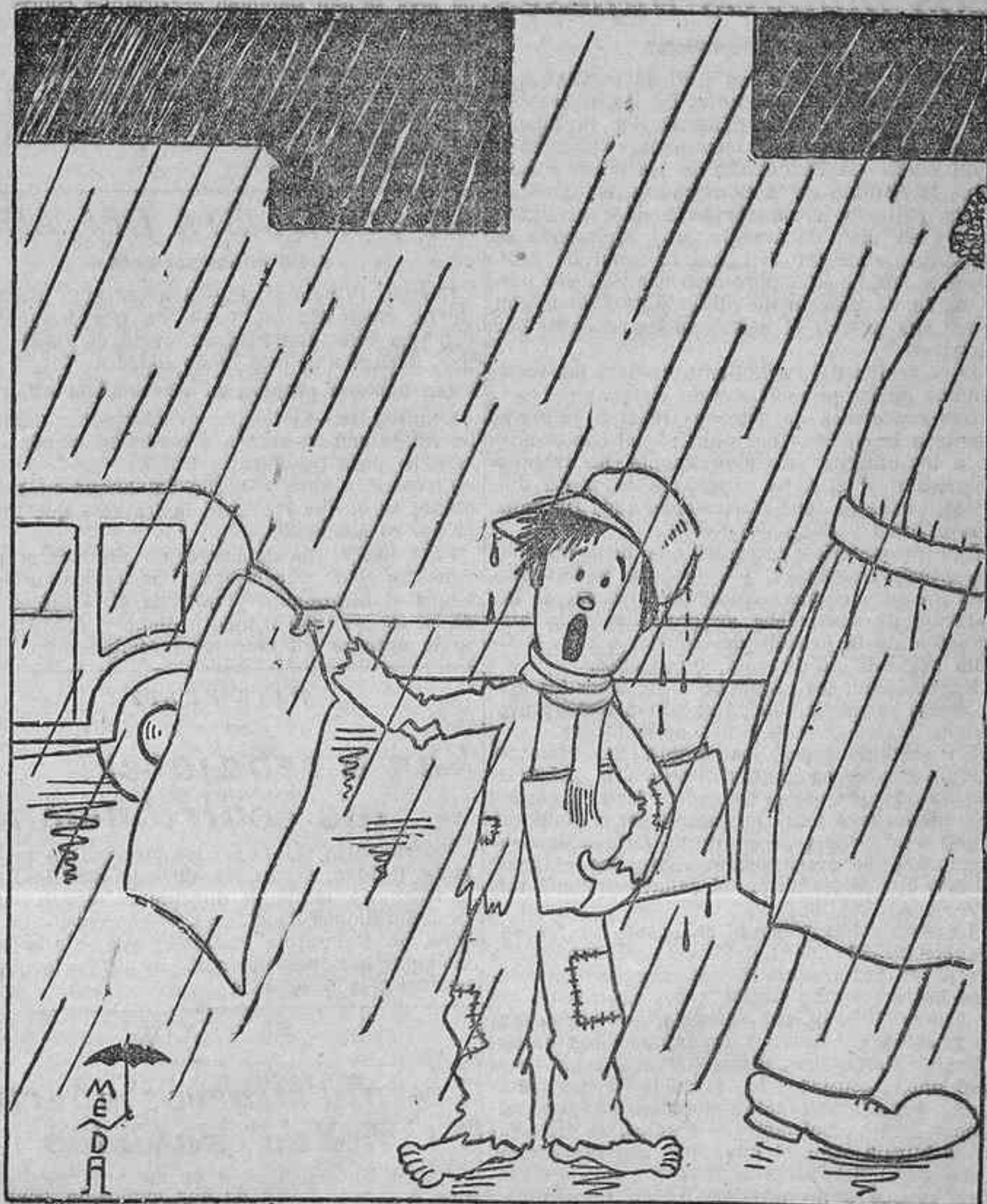
... Con las últimas noticias de la Semana del Niño,