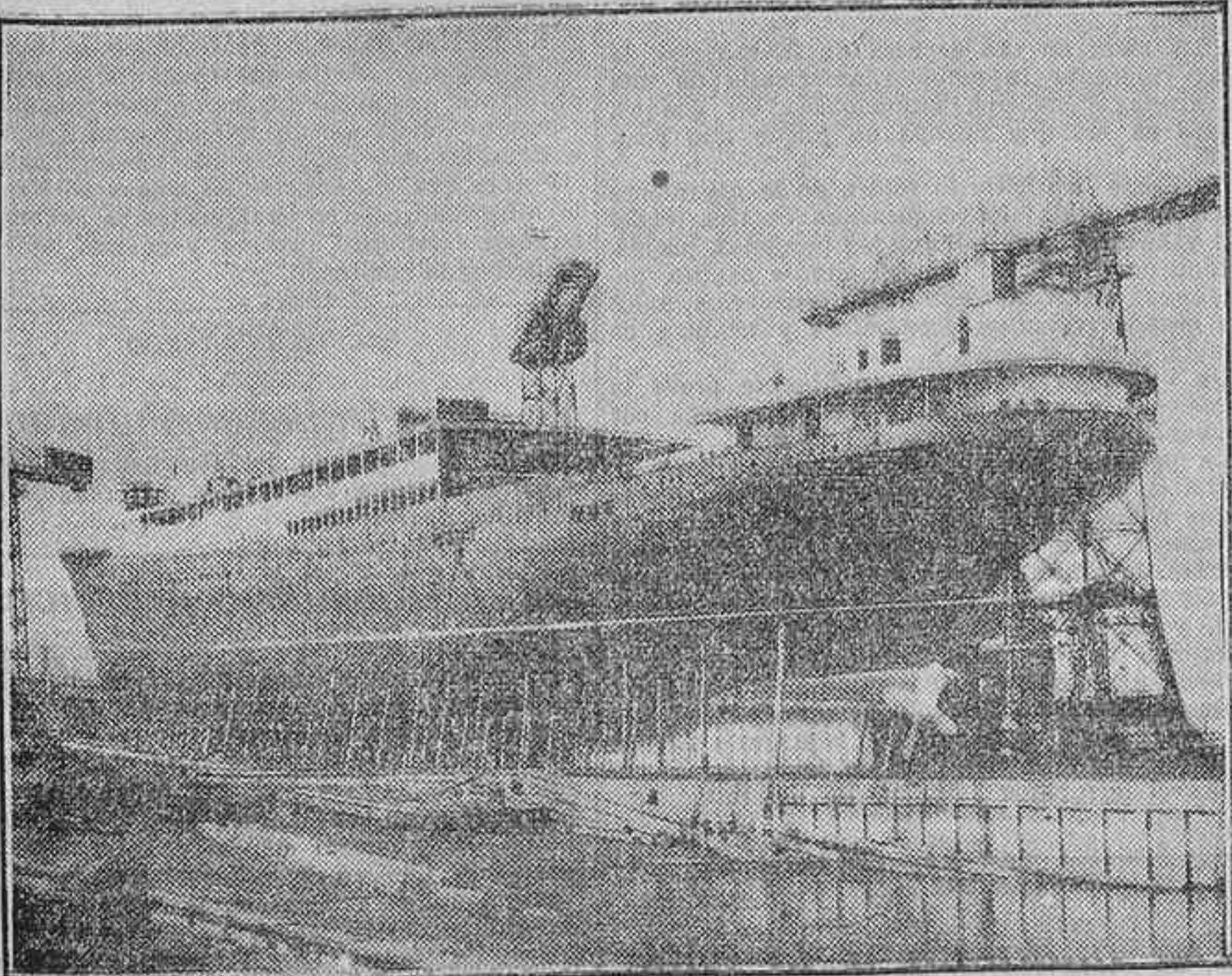
EL MAGNIFICO TRANSATLANTICO «JUAN SEBASTIAN EL CANO» MOMENTOS ANTES DE SER BOTADO AL AGUA

Dos juegos de turbinas con engranaje de simple reducción y potencia total de 6.750 SHP, trabajando con una presión en caldera de 12,66 kilogramos por centímetro cuadrado, dando las hélices con esta potencia 125 revoluciones por minuto.