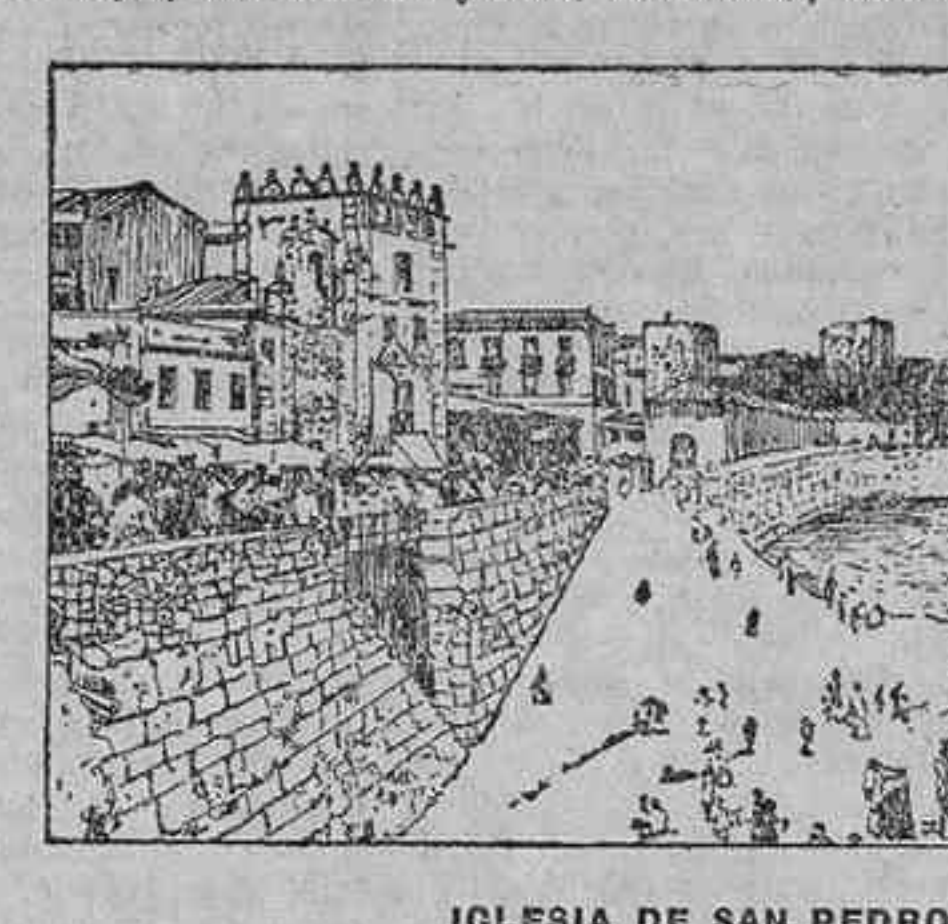
IGLESIA DE SAN PEDRO: VISTA A LA PLAYA