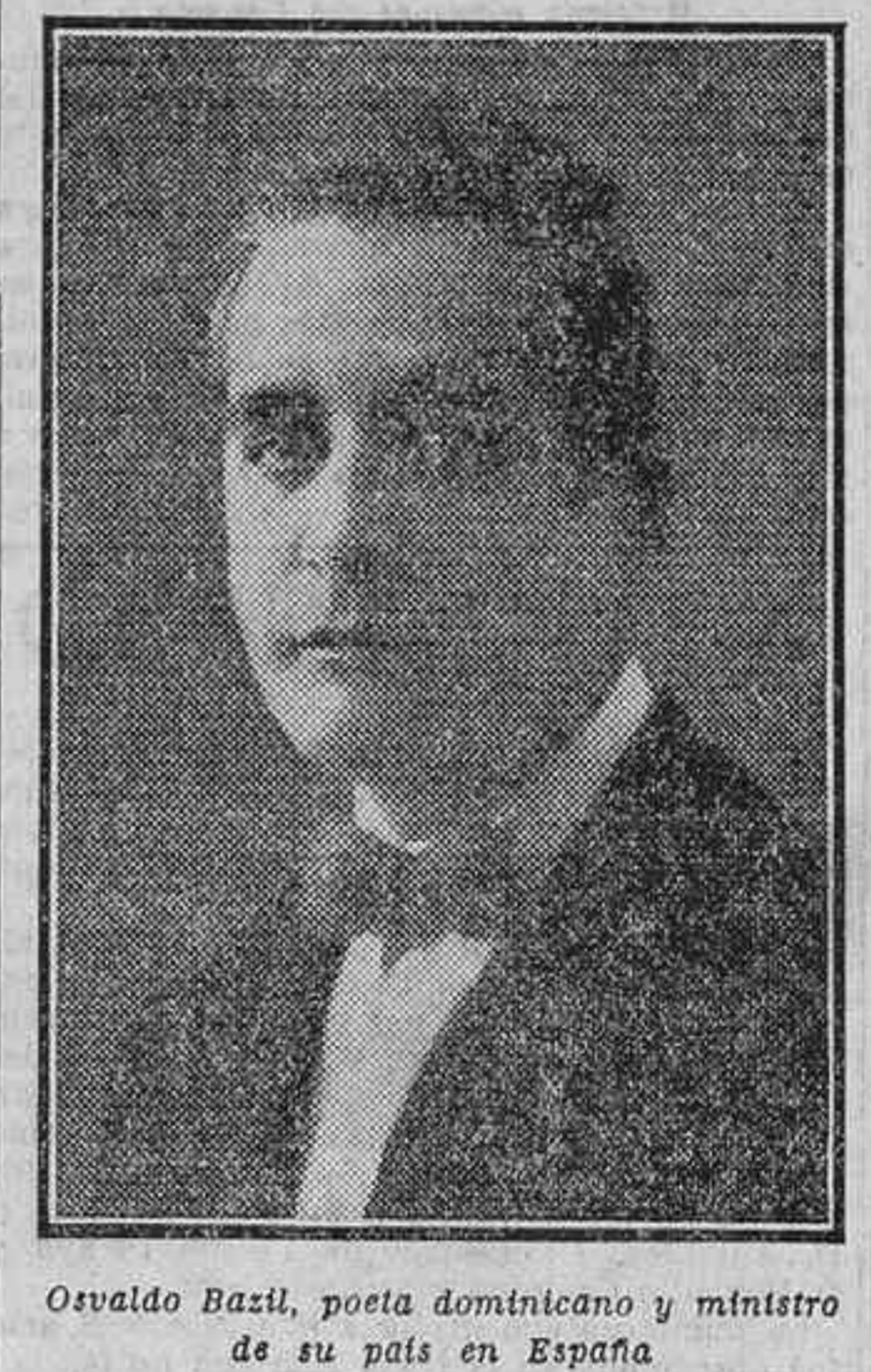
Osvaldo Bazil, poeta dominicano y ministro de su país en España

El poeta Osvaldo Bazil es bien conocido por los lectores de habla española, y casi pudiéramos decir familiar en nuestro mundo literario.