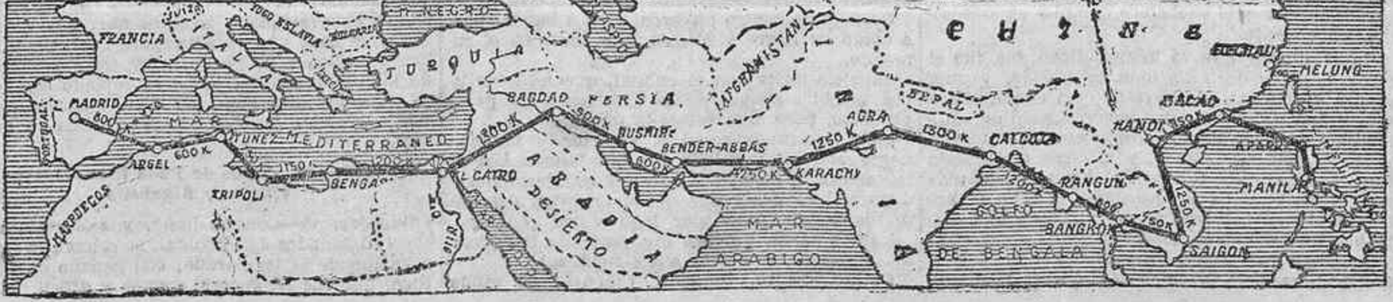
GRAFICO DEL VIAJE AEREO MADRID-MANILA QUE AYER TERMINARON BRILLANTEMENTE LOS CAPITANES LORGA Y GALLARZA, Y EN EL QUE HAN VOLADO CIENTO QUINCE HORAS, CUBRIENDO 17.020 KILOMETROS DE DISTANCIA