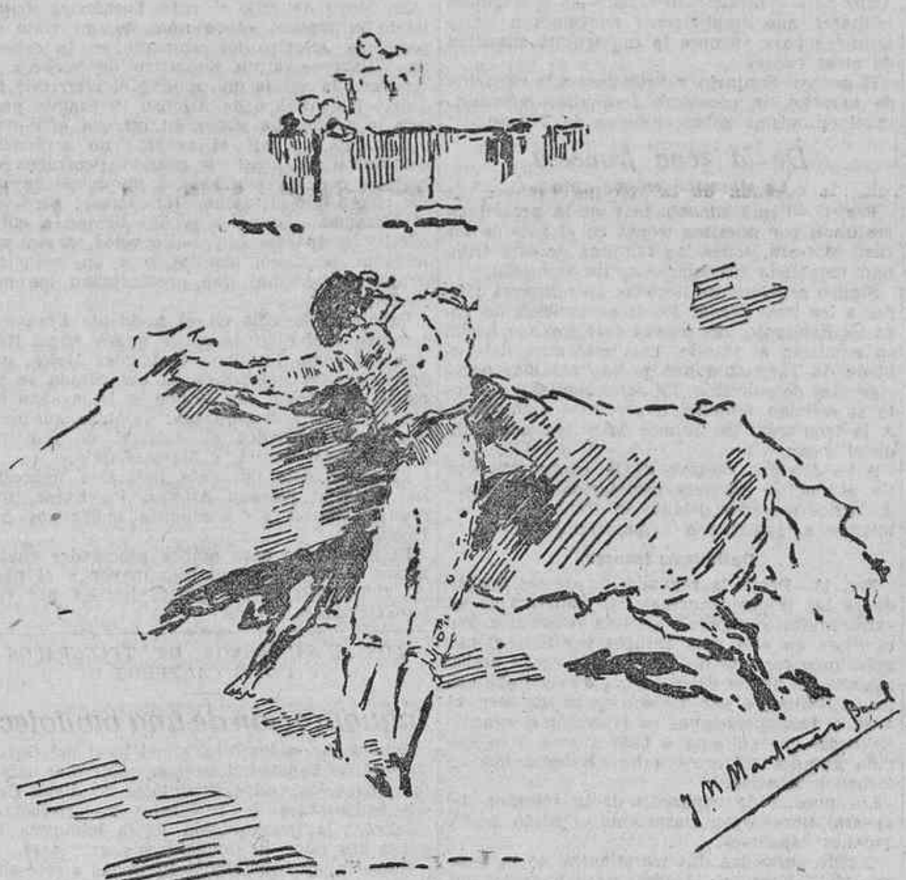
LA CORRIDA DE AYER EN MADRID.—UNA VERONICA DE BARAJAS (Apuntes del natural por Martínez Bande.)

Su labor fué objeto de ruidosas protestas, y a estas horas sólo sabemos de él que es de Ronda