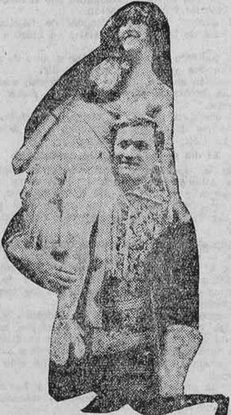
Ann Pennington y Tom Mix, en «El vaquero sevillano»

Y como nos lo cuenta Neptuneo... lo contamos.