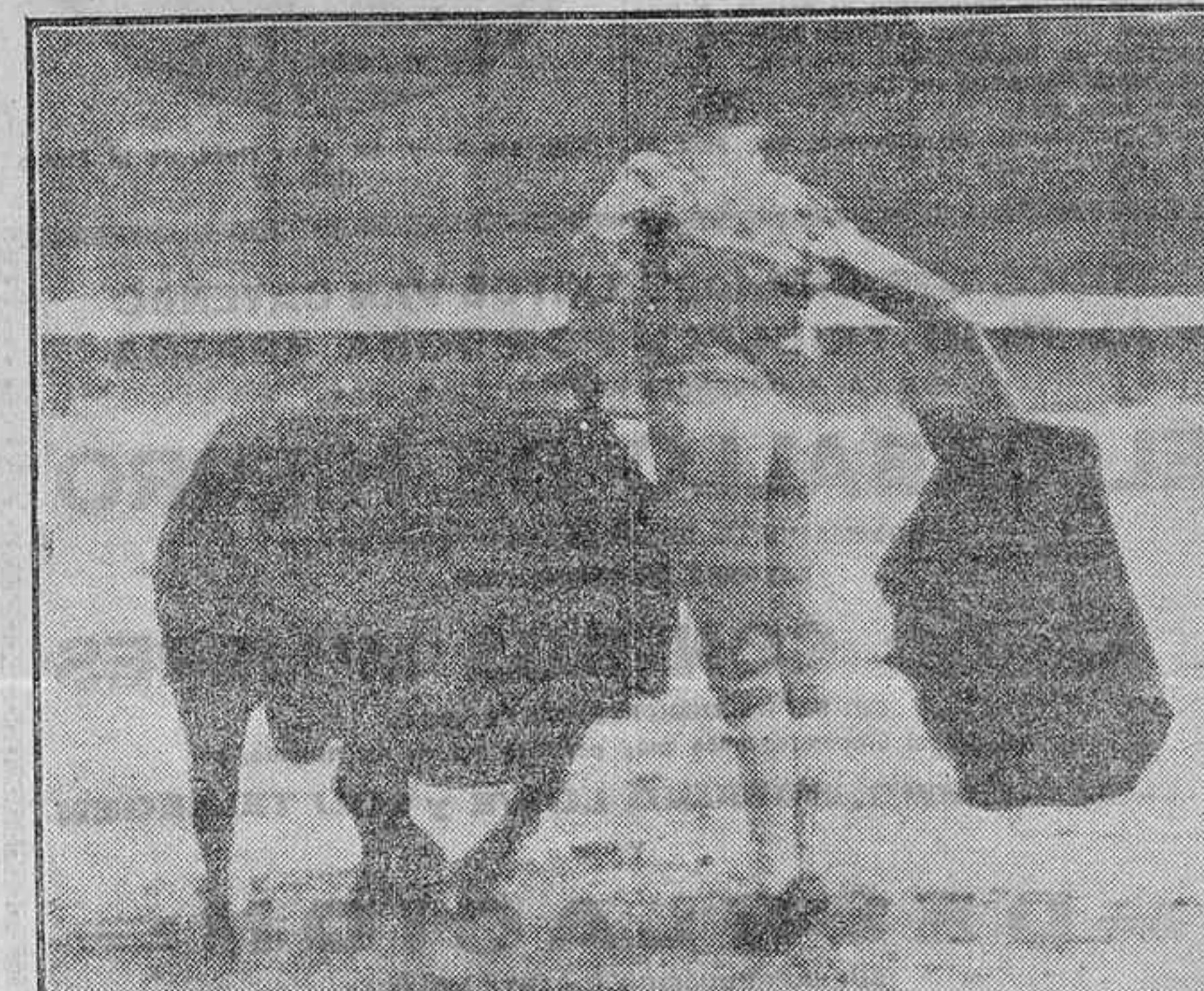
UN PARON DE VILLALTA