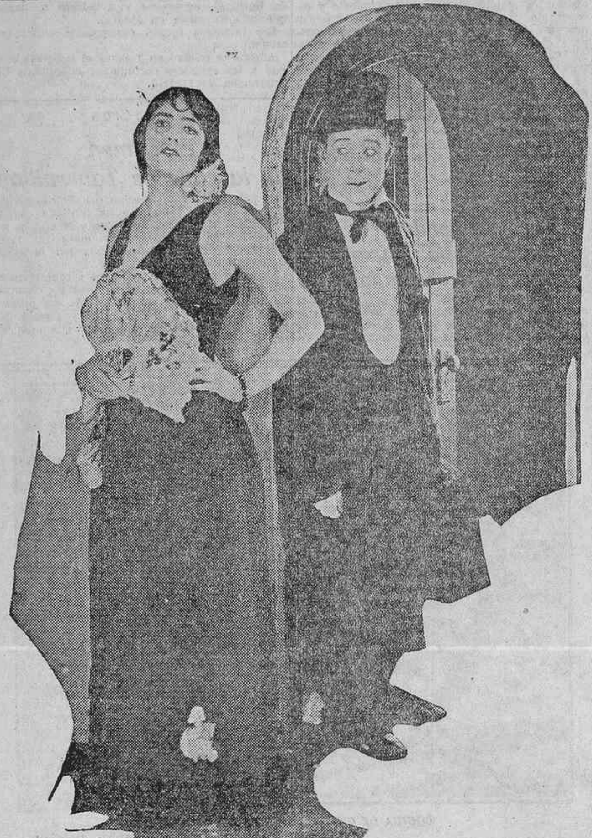
NATHALIE KINGSTON, CON HARRI LAUGDON EN «SU NUEVA ESTRELLA»

Madge Bellamy, GEORGE O'BRIEN y Margaret Livingston