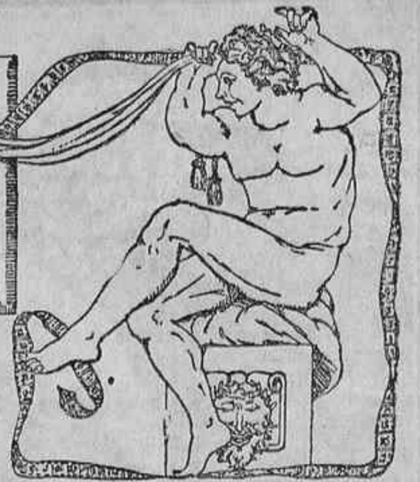
LAS RUTAS DE LA VIDA