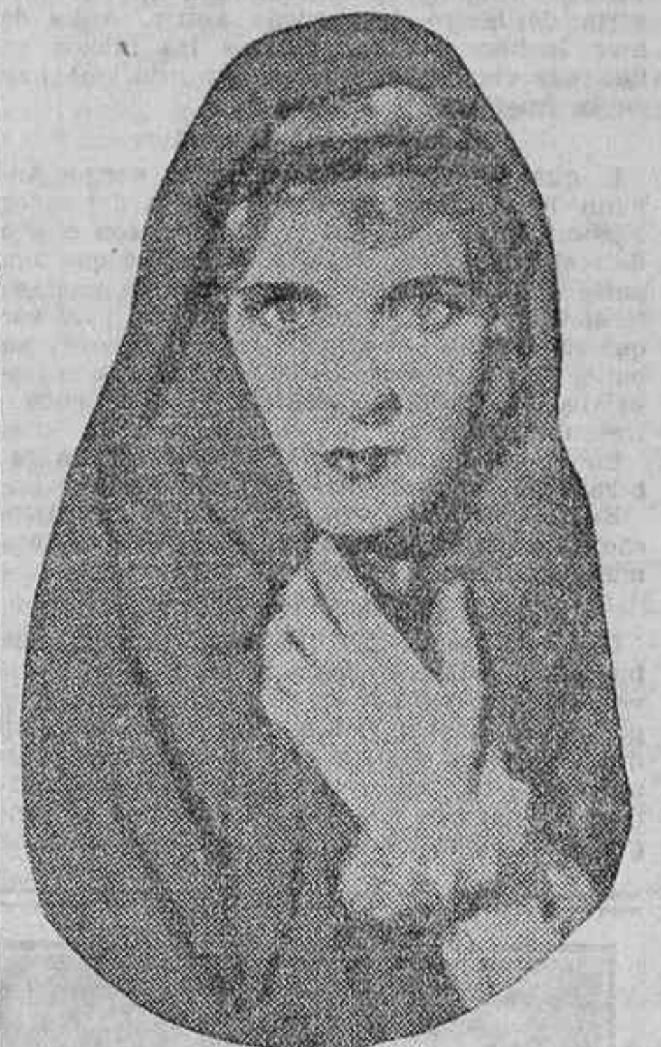
May Mo Avoy, en «Ben Hur», de la Metro Goldwin

Carl Laemmle, hombre que ofrece franca simpatía, es, pues, un prestigio mundial y un hombre de lo que puede la voluntad en las rutas de la vida de los hombres.