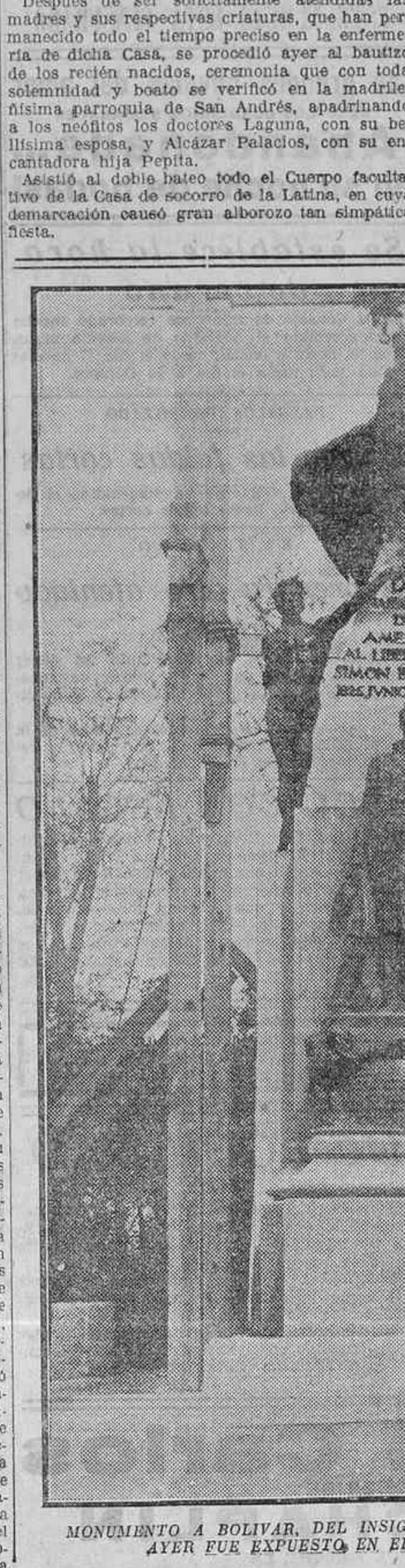
MONUMENTO A BOLIVAR, DEL INSIGNE ESCULTOR MARIANO BENLUIRE, QUE AYER FUE EXPUESTO EN EL ESTUDIO DEL GRAN ARTISTA