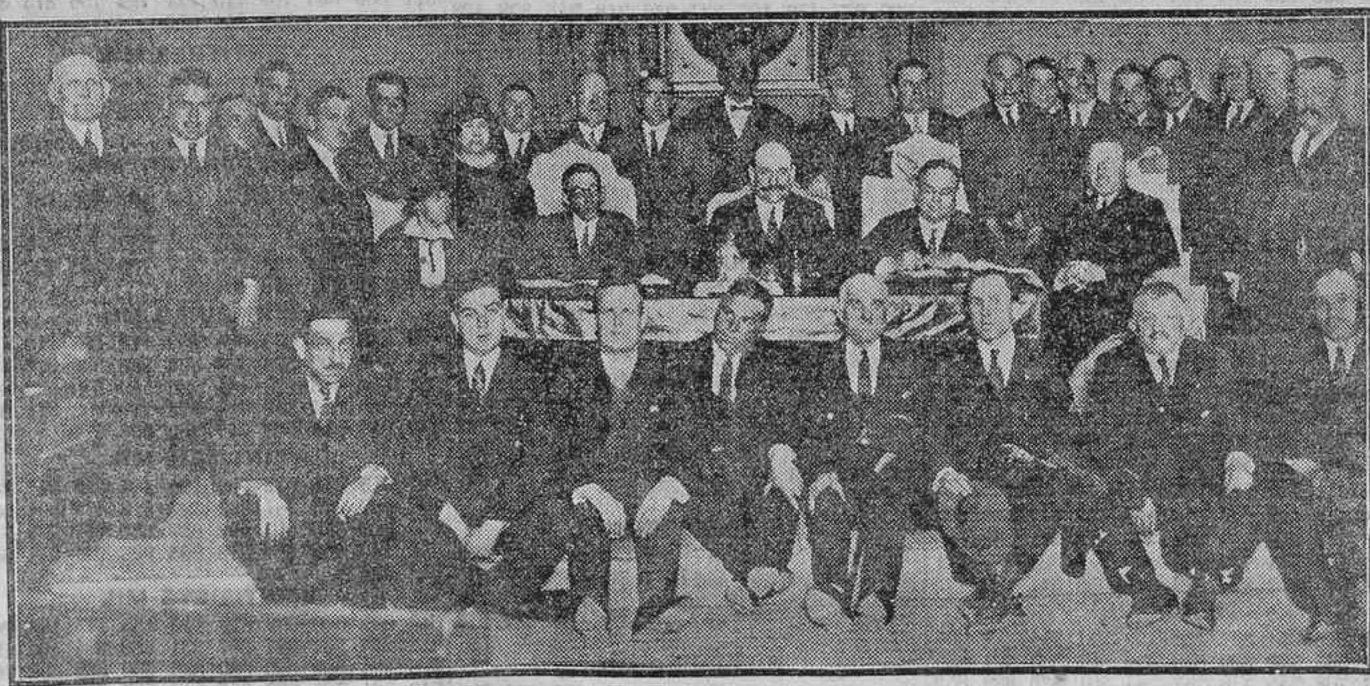
MAESTROS NACIONALES QUE HAN TOMADO PARTE EN LA ASAMBLEA DE LA ASOCIACION DEL MAGISTERIO, CLAUSURADA AYER.

Su compañero, el teniente Kerschend, se vió obligado a aterrizar a 20 millas de Rangoon, y ha llegado a esta localidad en automóvil, desistiendo de continuar el vuelo.