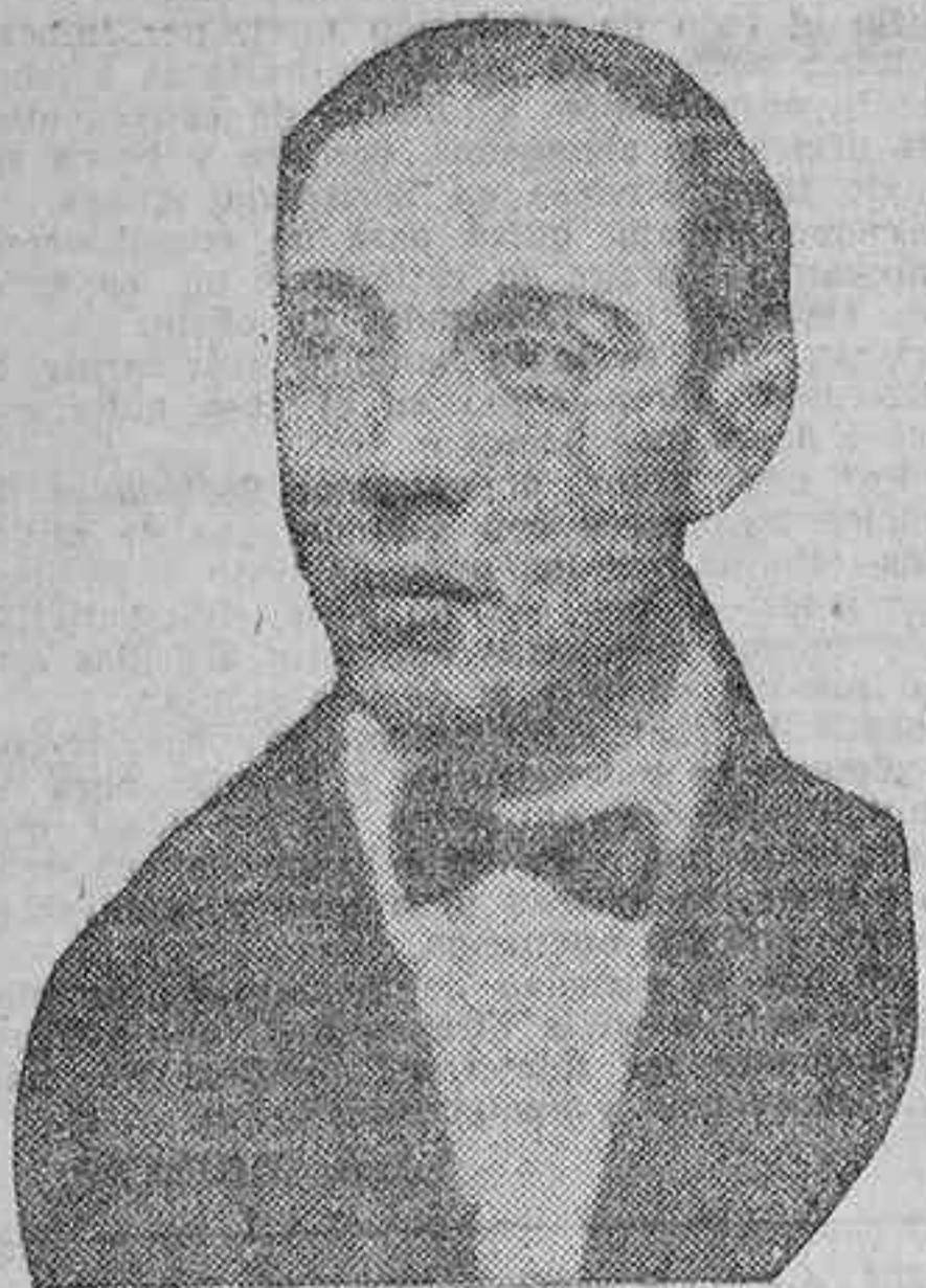
El hombre más serio del mundo: Buster Keaton. Y también uno de los que más hacen reír en el mundo