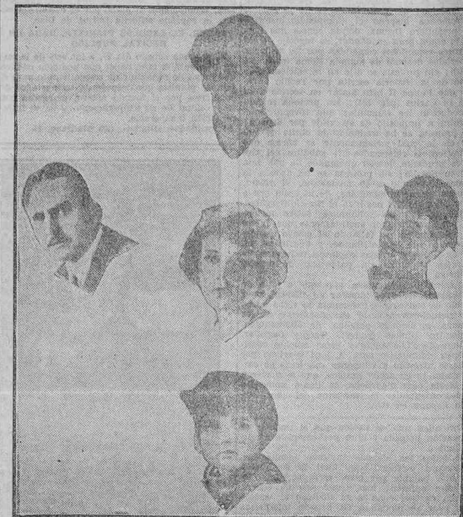
ASES DE LA PANTALLA; DOUGLAS FAIRBANKS, CHARLOT, BISHOOT, BHIQUILIN Y MARY PICKFORD

«Producción ARDAVIN». Manuel Silveira, 7. Madrid