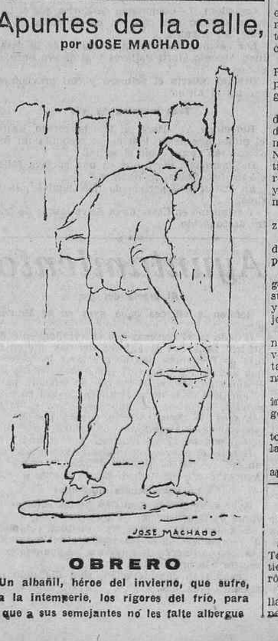
Un albañil, héroe del invierno, que sufre, a la intemperie, los rigores del frío, para que a sus semejantes no les falte albergue

La edad de admisión al trabajo ha sido fijada en doce años para la industria y en dieciocho para las minas; se prohíbe el trabajo de noche a las personas de menos de diecisiete años; la duración del trabajo no excederá de diez horas diarias, comprendiendo una hora de descanso, por lo menos, ni de sesenta horas por semana; en las minas el trabajo no será superior a seis horas diarias, comprendiendo en ellas la subida y la bajada y una hora de descanso; el tipo de salario aplicable a las horas suplementarias, cuyo número se fija, tiene un aumento de 50 por 100.