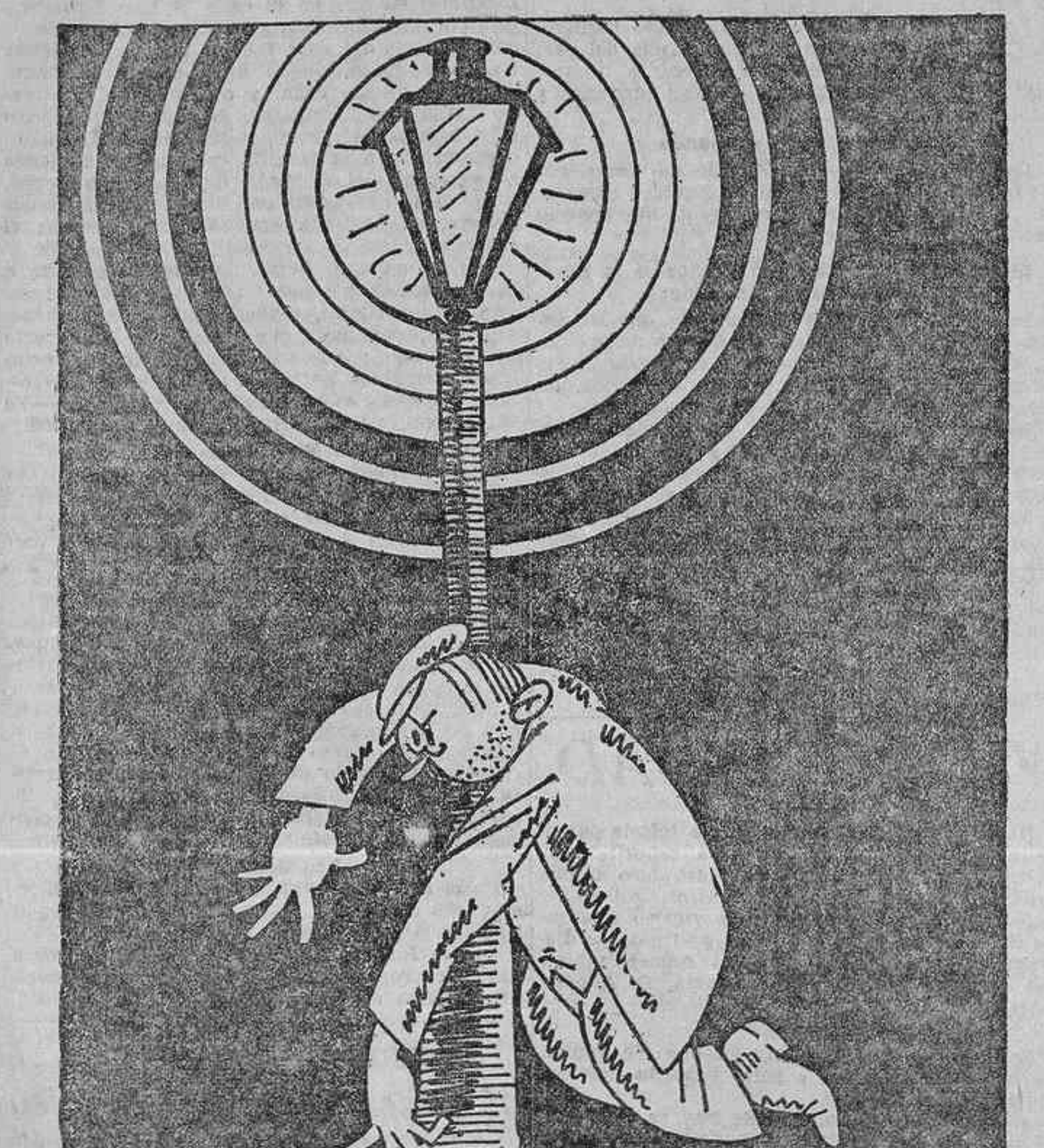
El curda.—Bueno; y si nos quitan nuestro clásico viva, ¿qué vamos a decir? ¡Vivan las fiestas de otoño!