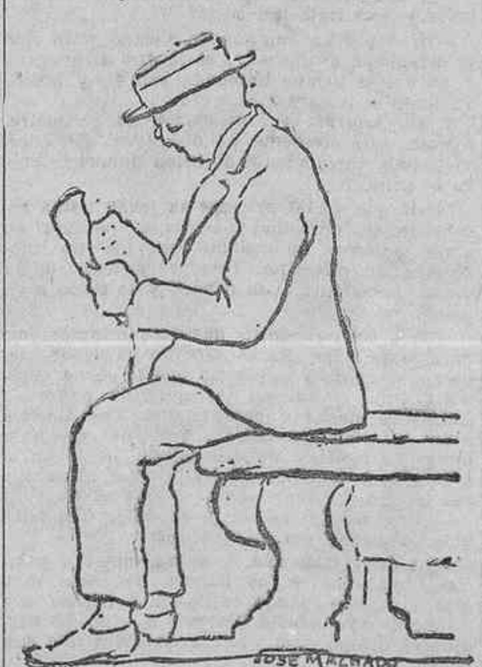
LECTOR En el periódico lee las noticias de toda clase de atropellos.

los, sino a las voces eternas, augustas, de los «maestros»—los libros—, que esperan arriba, en el salón de lectura, y que, sin aturdirles con su griterío, les vayan enseñando a pensar y a sentir, y tal vez a llegar a expresarse, si pretenden ser escritores, en el lenguaje sublime de la Verdad y de la Belleza, dos deidades que siempre estarán «arriba», dicho sea en el doble sentido que en esta ocasión tiene la palabra.