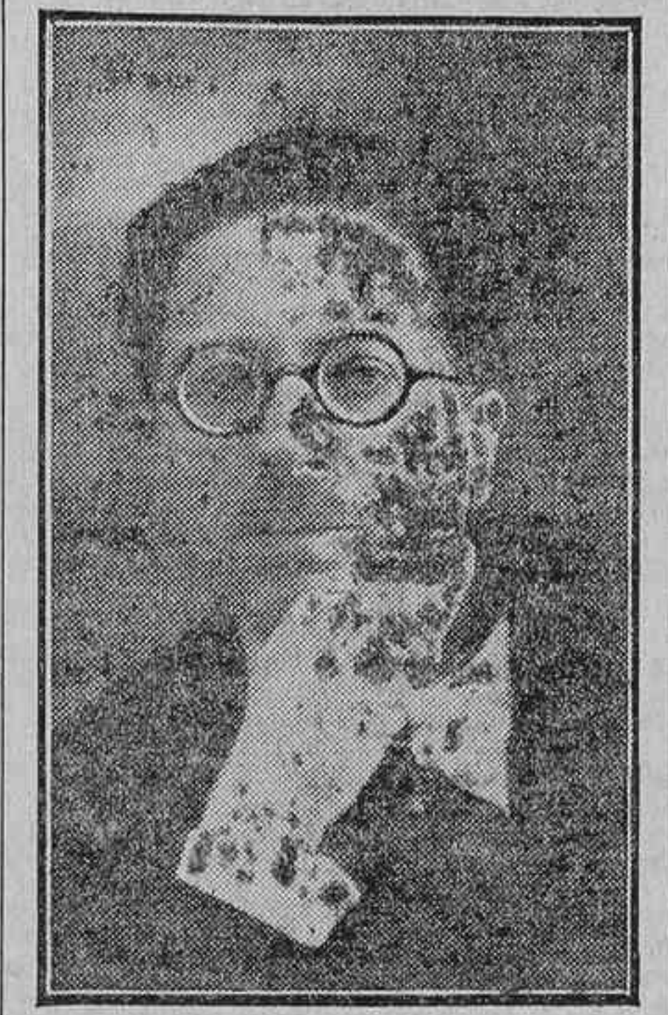
EL MAESTRO ALONSO

Tengo fe ciega en la regeneración del arte lírico nacional. Y esta obra, con tanta honradez pla-