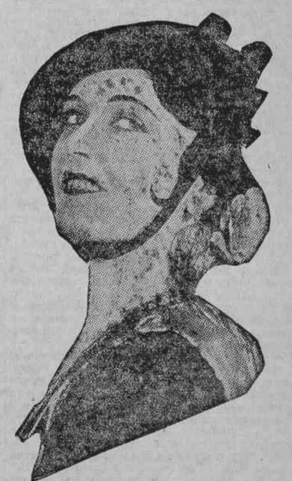
Pola Negri, la de los ojos seductores, en «La Salomé de los barrios bajos».

Puede que alguien... (Nunca faltan los hijos espirituales del ya celebrísimo «Don Quixote».) Puede que alguien responda con una mueca no grata al optimismo que vamos reflejando en este comentario. Pero... ¿cómo remediar el desagrado de los del voto en contra por sistema?