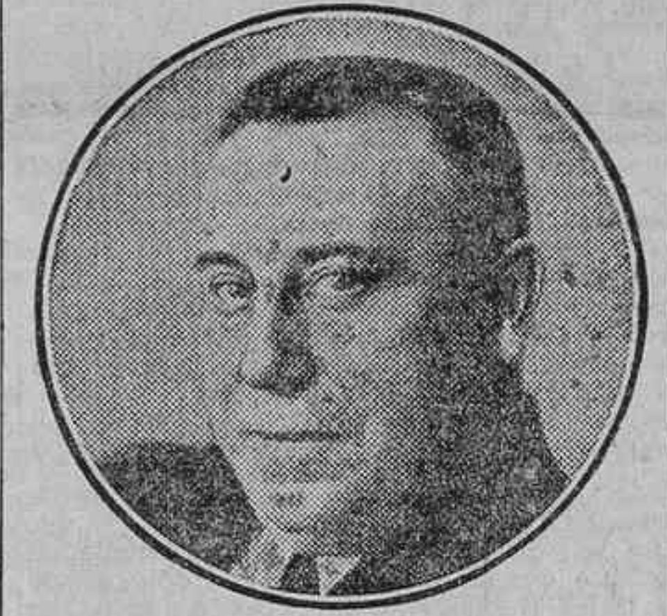
EL MAESTRO LUNA

En mi anhelo de que por el escenario de Pavón desfilasen esta temporada todos los autores