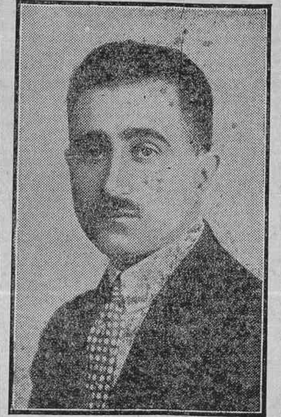
EL MAESTRO MORENO TORROBA