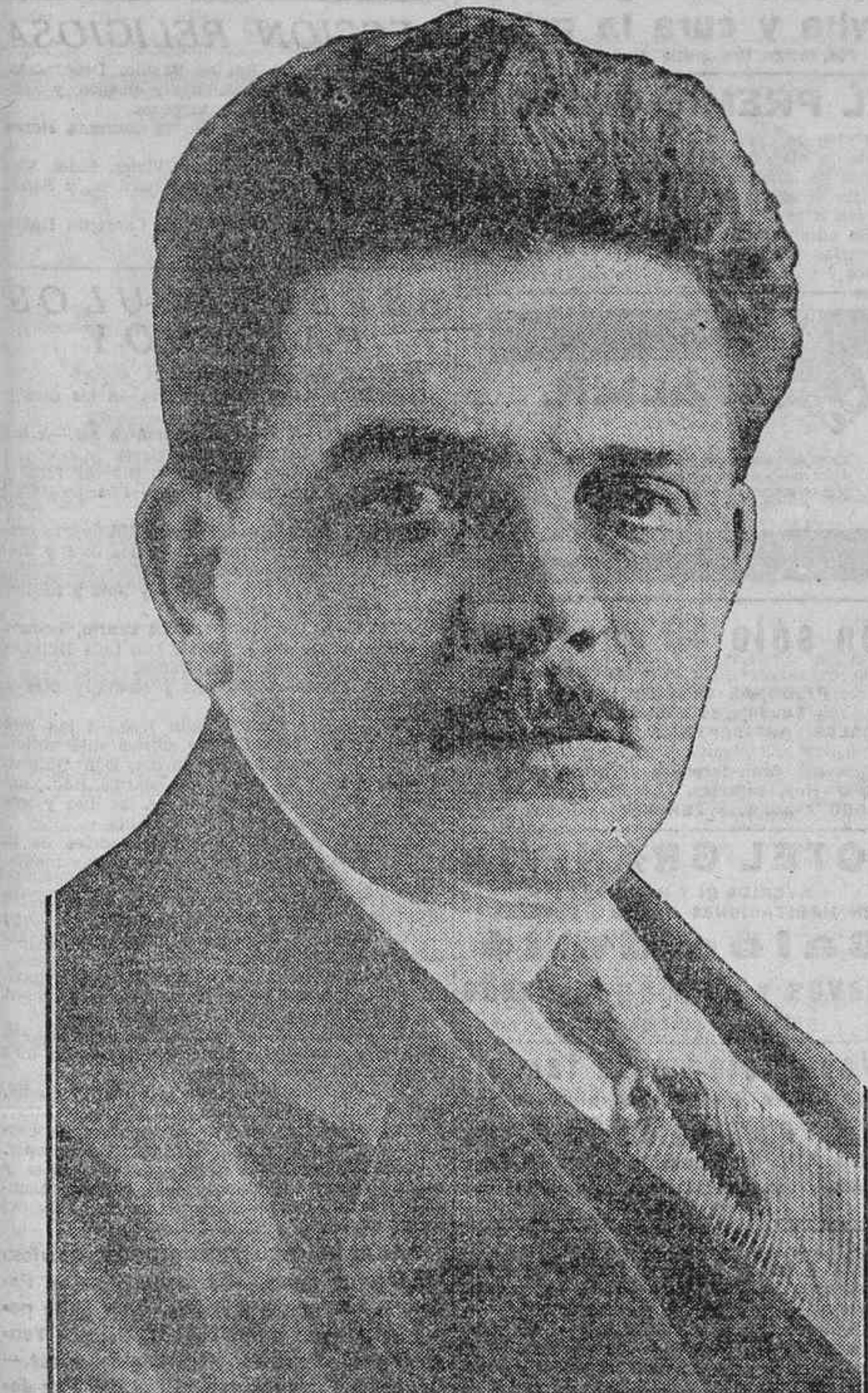
HERRIOT, JEFE DEL GOBIERNO FRANCÉS, CUYO MAGNÍFICO DISCURSO DE TONOS RADICALES PROYOÓ EN LA CÁMARA LA INDIGNACIÓN DE LAS CLÉRICALES DEBERCHAS