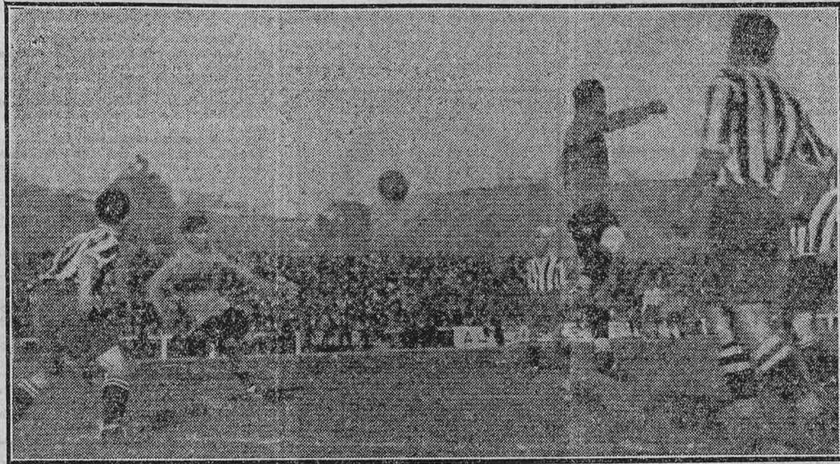
EL PARTIDO ARGENTINO-ATHLETIC.—UN PASE DEL ALA DERECHA DE LOS ARGENTINOS, MIENTRAS OLASITO SE APRESTA A LA ENTRADA

De aquel equipo magnífico que mandó el Uruguay, que tantos triunfos supo lograr, nos quedó un cierto amargor... Hasta entonces, hasta la visita de los futbolistas uruguayos, España marchaba a la cabeza del fútbol «amateurs»... más o menos mixtificado. Pero llegó aquel equipo, hizo una victoriosa «tournee» por toda la Península, y en Colombia, mientras nuestro «once» nacional era eliminado al primer encuentro, quedó clasificado como campeón mundial.