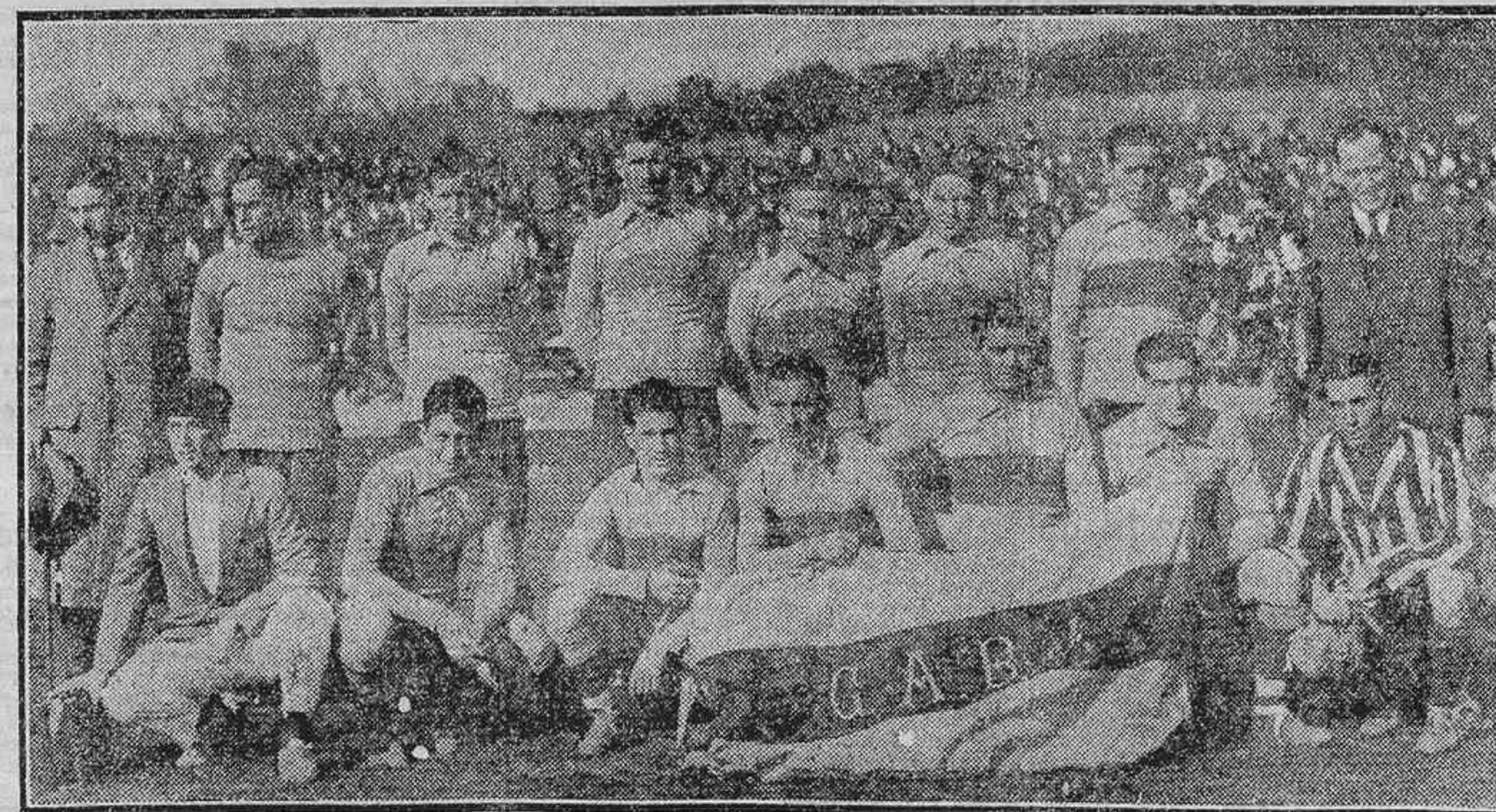
EL PARTIDO ARGENTINO-ATHLETIC.—EL EQUIPO DE BOCA JUNIORS, QUE AYER YENCIO AL ATHLETIC POR 2 «GOALS» A 1

El intermedio entre la primera y la segunda parte es siempre interesante. El público de fútbol es especialmente y muy dado a comentar, con acritud, con pasión, a veces con falta de sentido. Es muy divertido caer en medio de un grupo de aficionados, de éstos que se apasionan