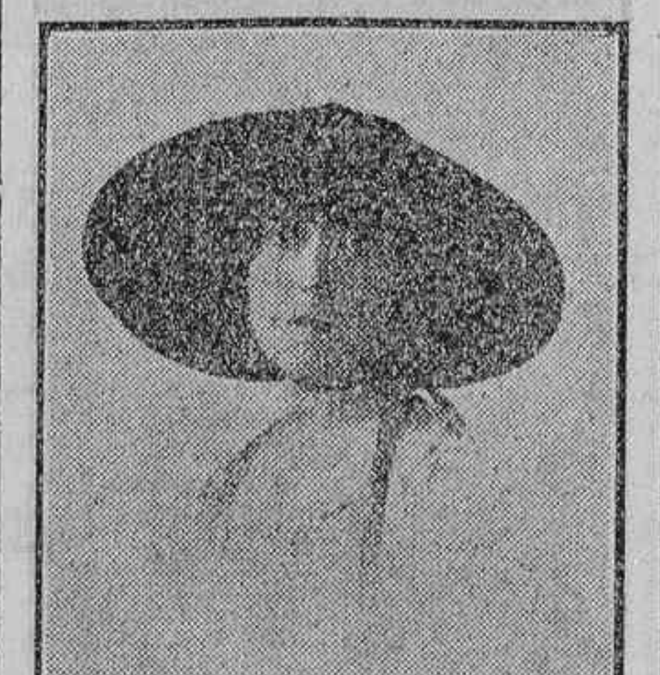
Concha Espina, insignie novelista, a cuya obra literaria ha dedicado Cansinos Assens un interesante libro