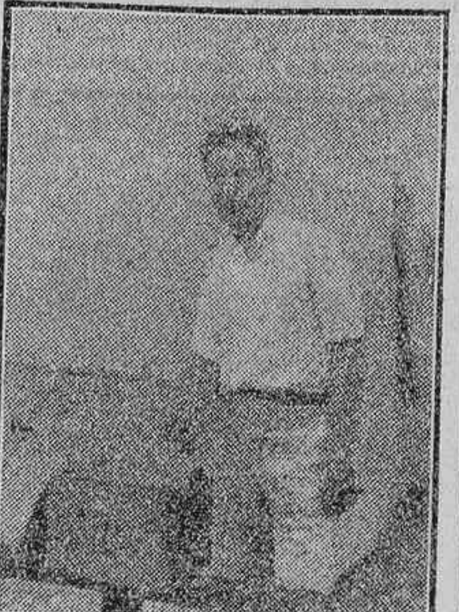
El eminente actor norteamericano Tomás Mejía