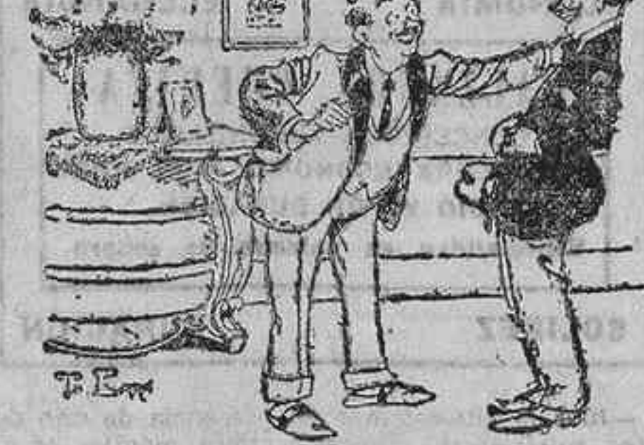
«Querido doctor, ya soy papá...» «Caramba, mi enhorabuena. ¿Será chico? No, señor, una chica. —Vamos, me he equivocado poco.»

DE BILBAO. Más cuarteles.—Noticias de la Diputación.—Un desprendimiento de tierras.—Para las obras del Canal.