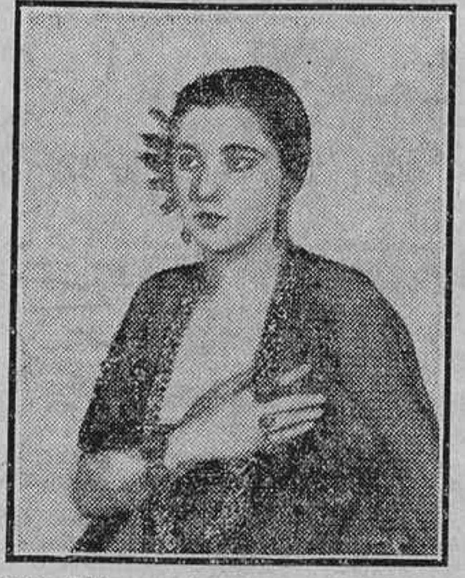
Nita Naldi, una de las más bellas actrices del film