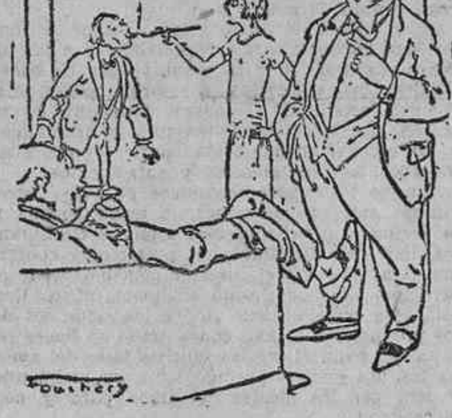
El padre.—Al fin, mi hija se casa. El amigo.—¿Y quién es el dichoso mortal? El padre.—El dichoso mortal, soy yo!