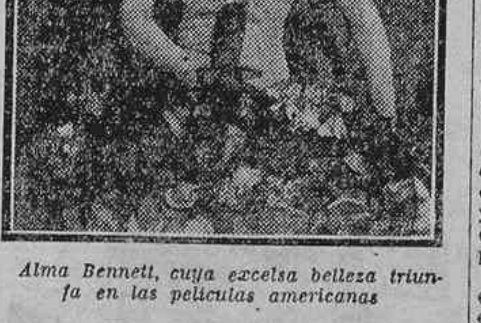
Alma Bennett, cuya excelsa belleza triunfa en las películas americanas

Por esos cines Don Juan Tenorio en película.—La inmortal obra de Zorrilla ha sido llevada de un modo magistral e inmejorable.