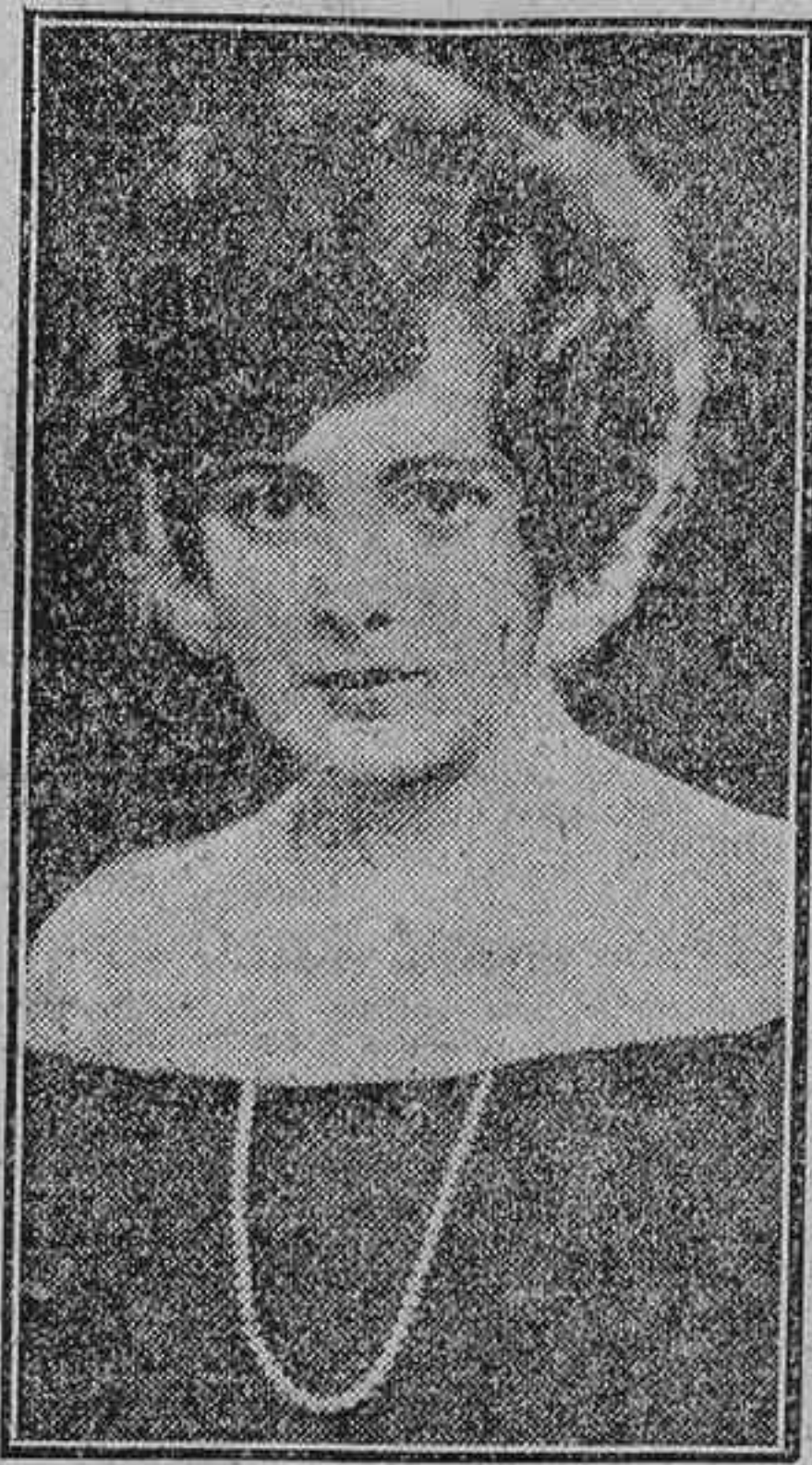
Billie Dove, la bellísima estrella norteamericana

Son cosas de América. Una Empresa yanqui pagó a Penella una importantísima suma de dólares por la autorización para impresionar la