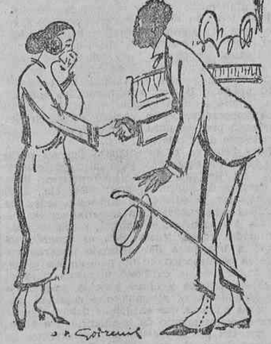
—«Amigo mío Es necesario repararnos. El doctor sólo me permite las carnes blancas.» (Le Rire.)