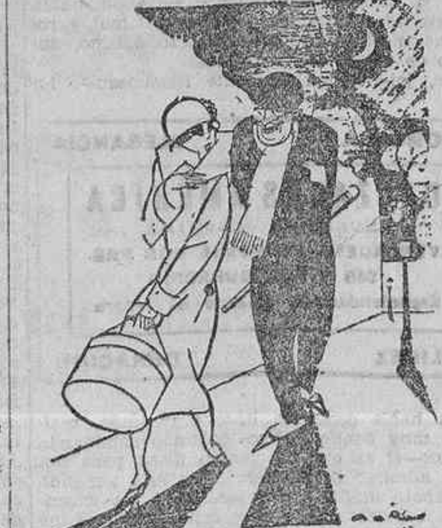
«No tienes miedo de ser comida por los lobos, ¿dónde caperuñita roja?» —«Oh! ¡Siendo viejos, ya no son temibles sus dientes!» (La Matin.)