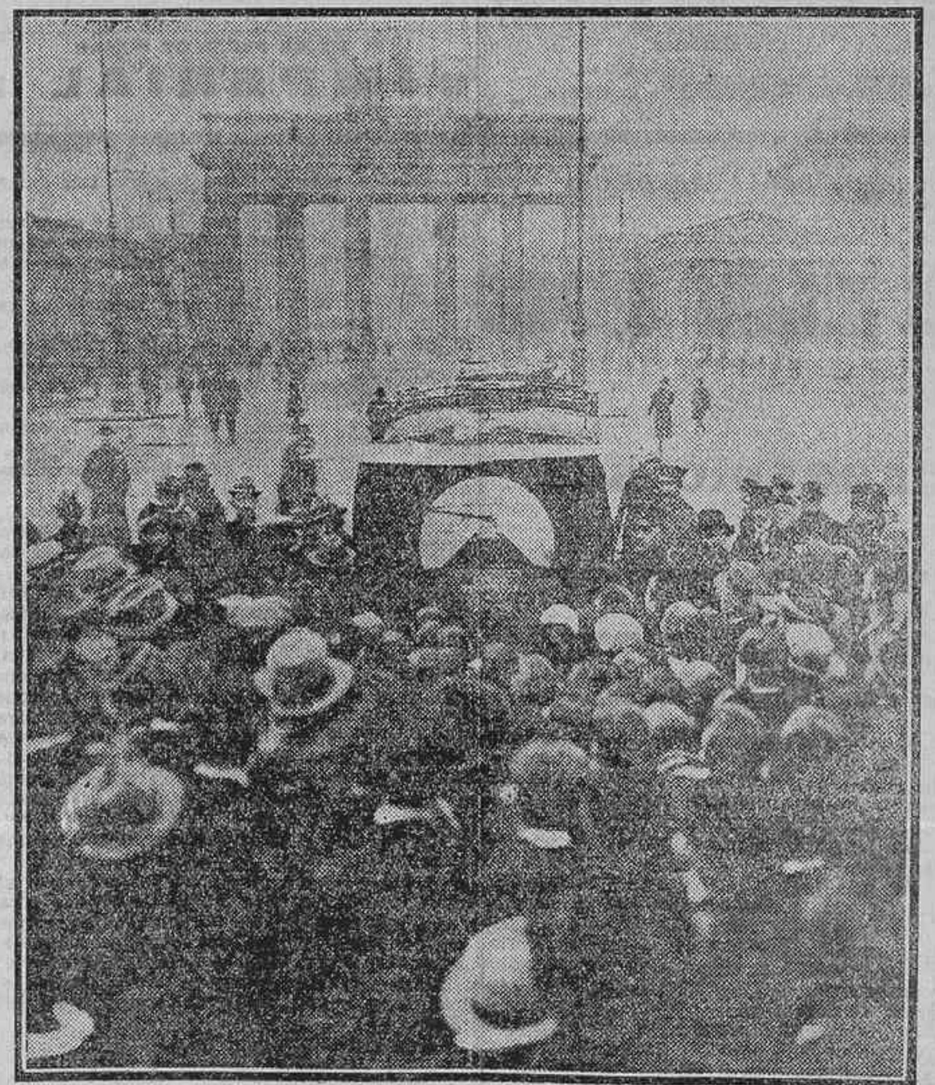
UN NUEVO APARATO CINEMATOGRAFICO PERMITE PROYECTAR LAS PELICULAS EN PLENA CALLE, SIN QUE LA LUZ DEL SOL LO IMPIDA