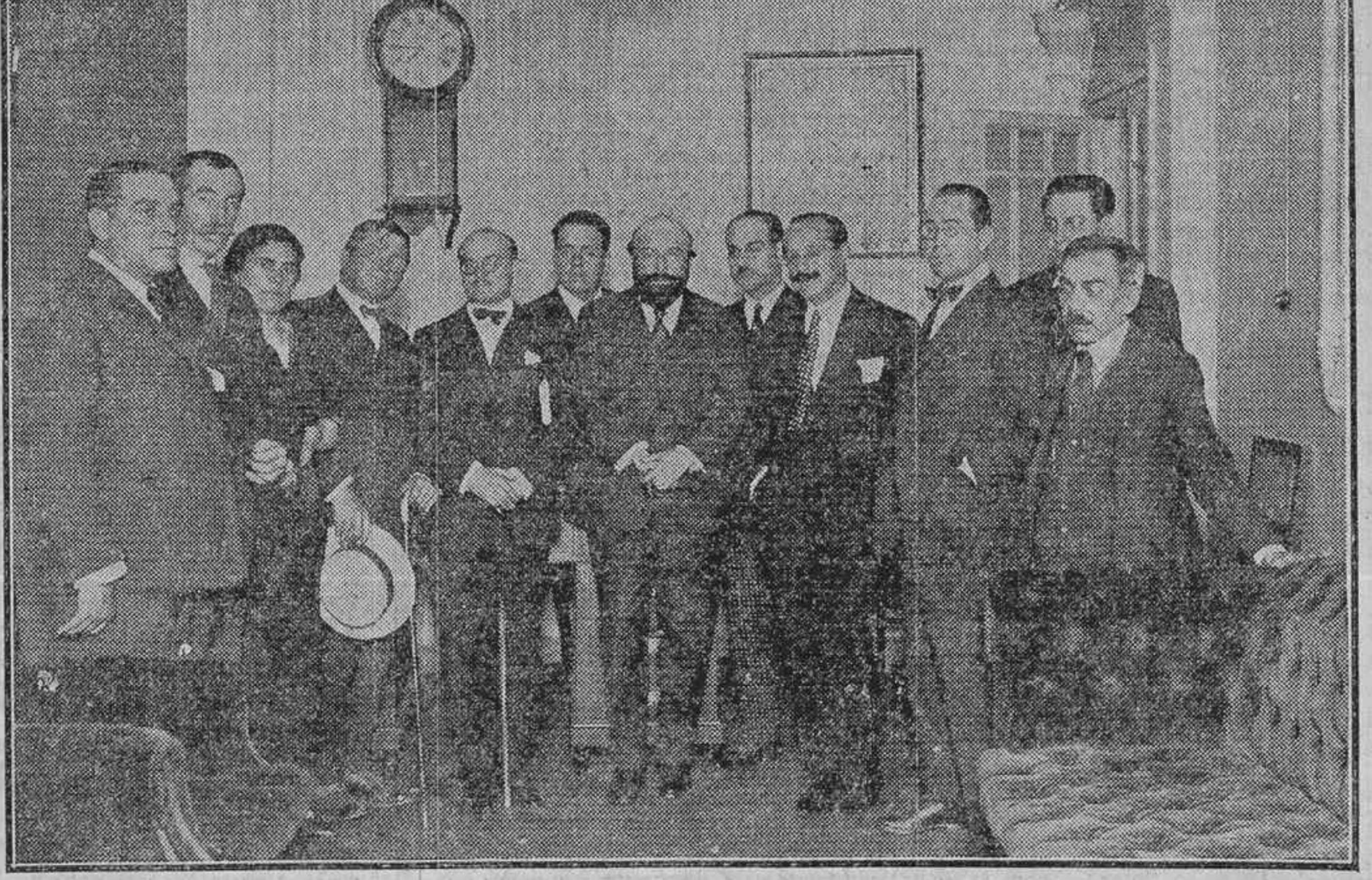
LA REPRESENTACION DE LA CASA DEL PUEBLO, ACOMPAÑADA DE LA JUNTA DE GOBIERNO DEL ATENEO, EN LA INAUGURACION DE LA NUEVA BIBLIOTECA DE LA DOCTA CASA