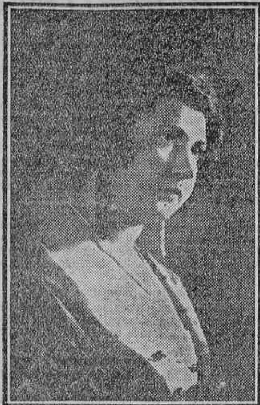
La primera actriz, Matilde Rivera