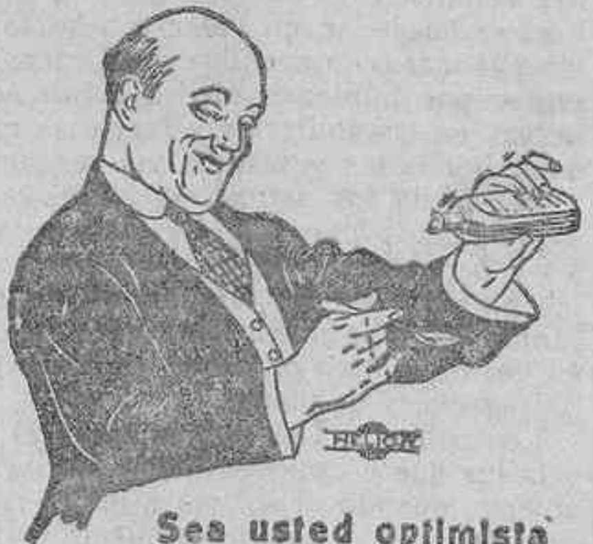
Sea usted optimista

Fortuna correspondió a la expectativa torreando bien, y en quites estuvo valiente, por lo que fué ovacionado. Con la muleta hizo tres temerarias faenas, dando pases de todas las marcas. Mató a sus enemigos de tres estocadas superiores. En el cuarto toro, al que banderilleó con cortas y mató ejecutando el volapié emocionantemente, se fueron concedidas las orejas.