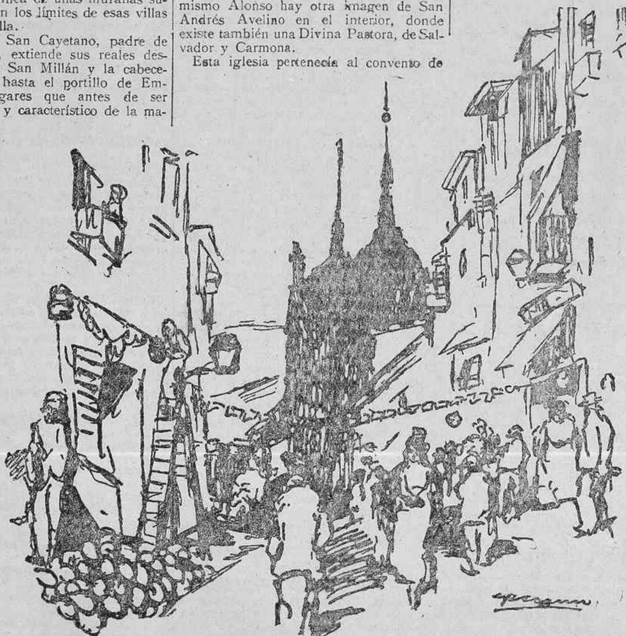
UNA CALLE VERBENERA

La fiesta de San Cayetano, padre de la Providencia, extiende sus reales desde la plaza de San Millán y la cabecera del Rastro hasta el portillo de Embajadores. Lugares que antes de ser albergue típico y característico de la ma-