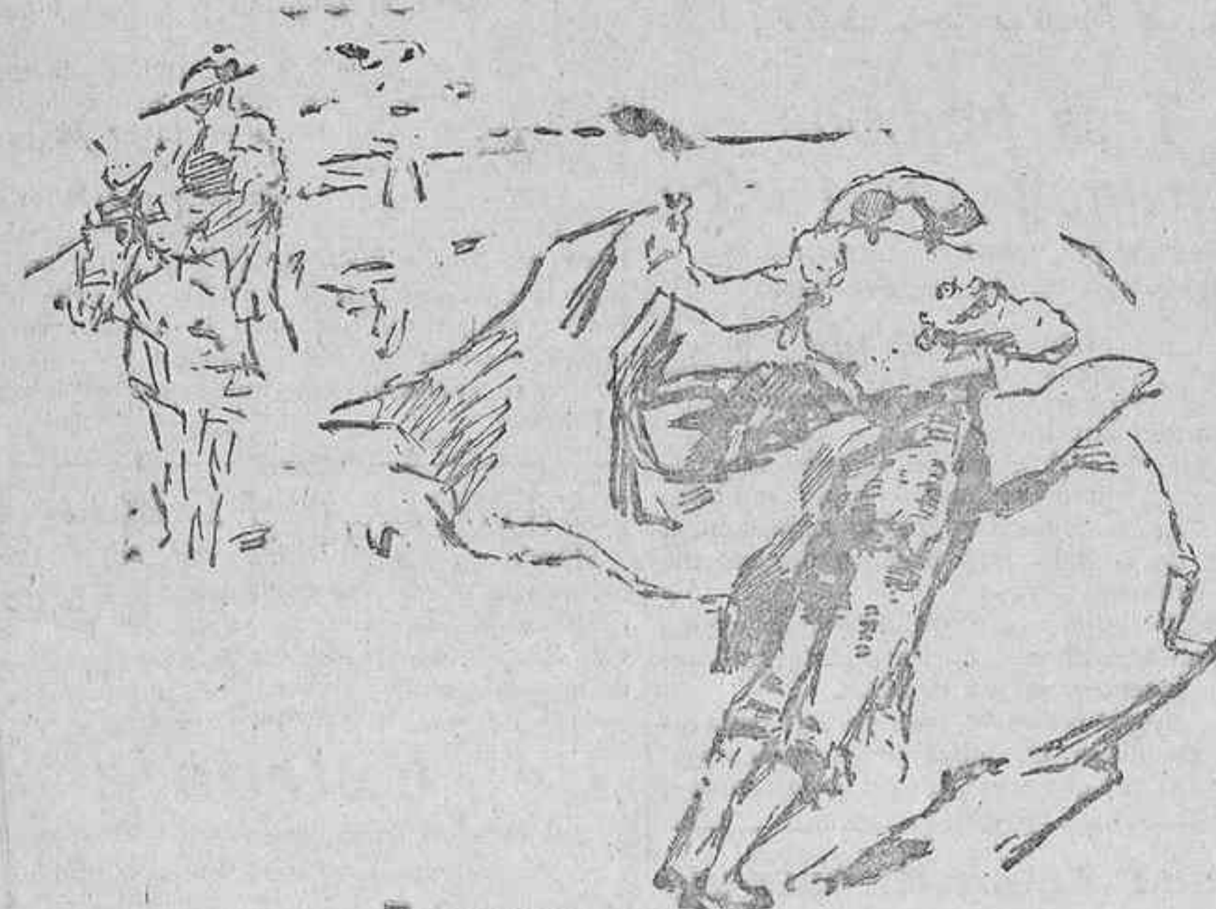
CARNICERITO EN UN CENIDO QUITE

¿No será éste el fallecido? Aunque nada nos ha dicho nuestro corresponsal en aquella población, recogemos la noticia, sin que respondamos de su veracidad.