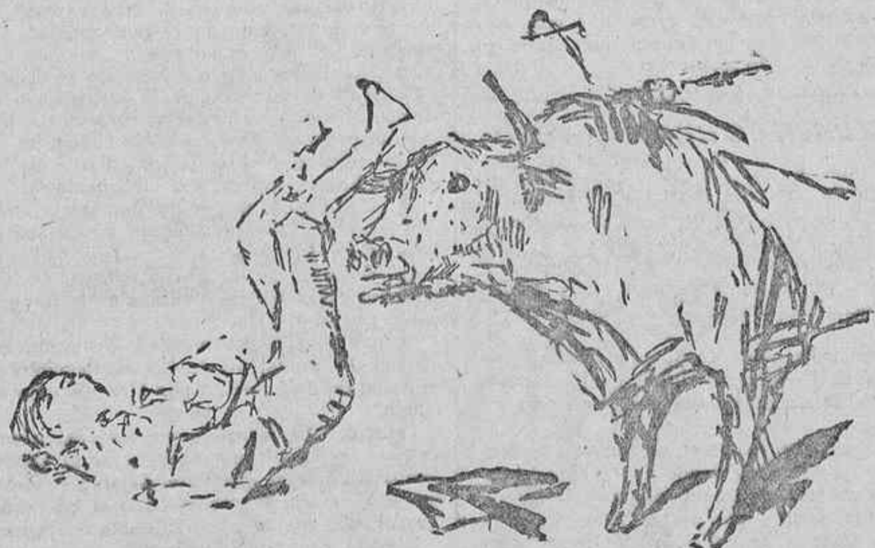
COGIDA DE VALENCIA AL MATAR EL SEGUNDO TORO

Rendirse sin lucha, nunca; darse por vencido, jamás. A las protestas se contesta demostrando lo que se es y lo que se vale; a la pasión, no con decaimientos, sino con arrestos, con pasión también; pero ante el enemigo, engrandeciéndose, superándose,