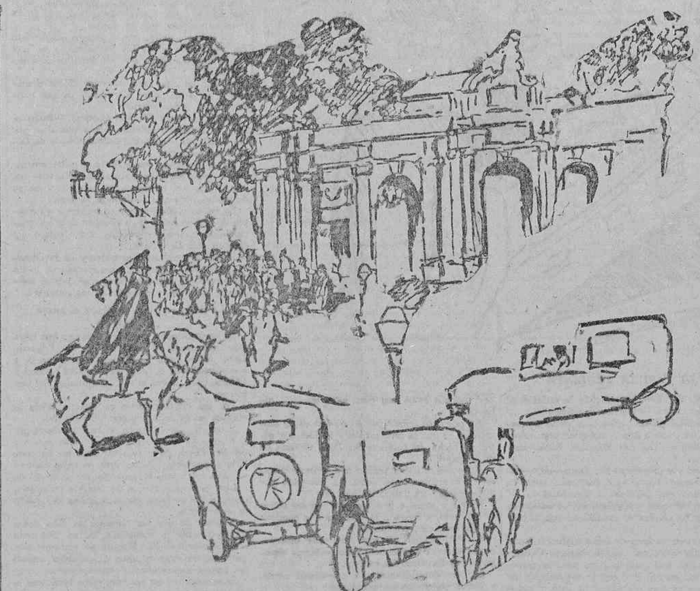
EL PUBLICO CONTEMPLANDO LAS HUELLAS DE LOS BALZOS EN LA PUERTA DE ALCALE