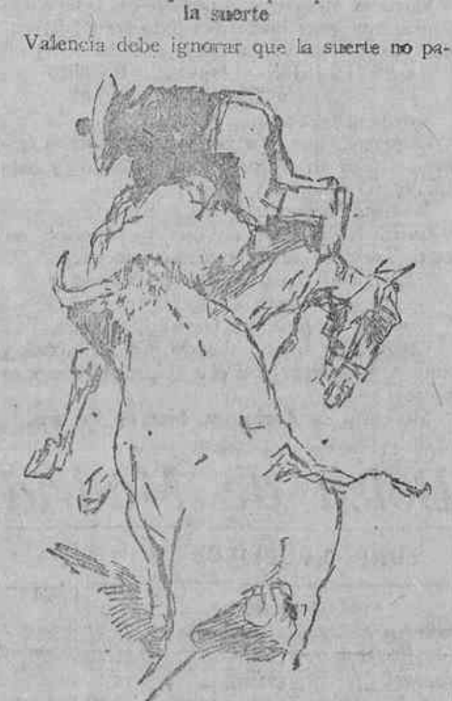
La primera vara del segundo Veragua