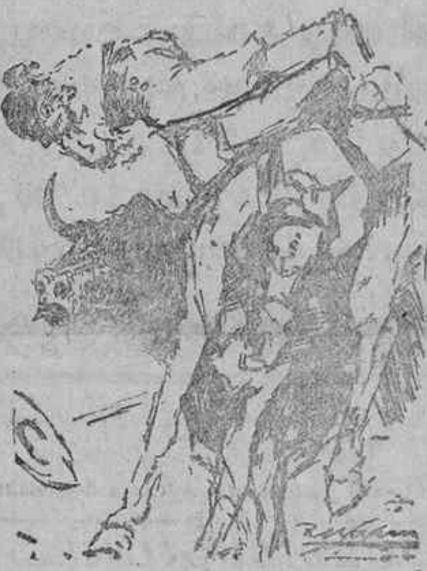
Cae al descubierto en el sexto toro